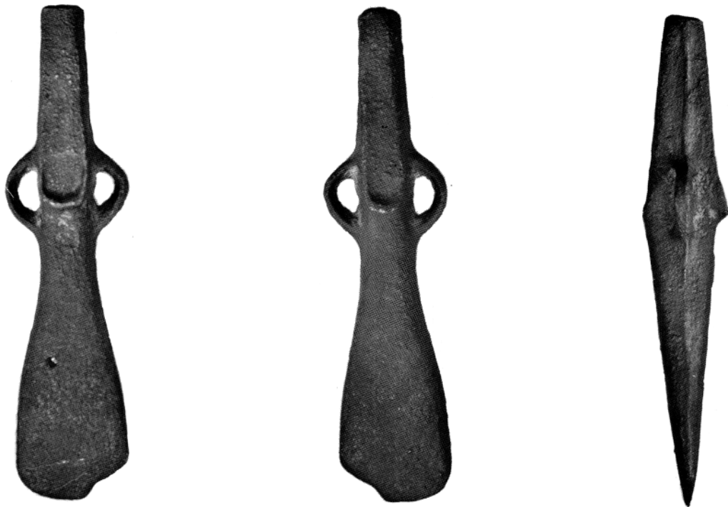
Fotos 1 a 3. Anverso, reverso y perfil del hacha de Larragain