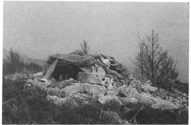
Fot. 1. Dolmen de Errolle-gain