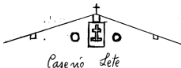
Fig. 1.— Posición de la cruz del caserío Lete.

La tipología de la cruz de Lete se repite en un caso vizcaíno como el de Otxantegui (NOLTE, op. cit. p. 22). Foto 4 y Figura 1 original de CALVO.