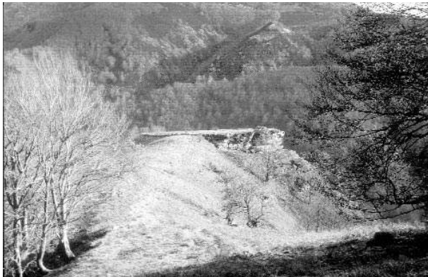
Photo 3. Irubelakaskoa vers Goramil. Talus artificiel prolongé d'une plateforme.

pour fondre sur les éventuels envahisseurs qui auraient eu l'imprudence de s'engager au fond des gorges.