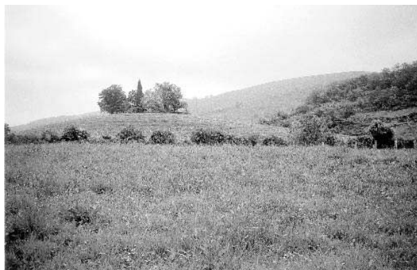
Photo 6. Motte féodale d'Irulegi -Basse Navarre-.

Néanmoins, il observe «l'analogie d' irulegi avec les noms Irun , Irunberri etc...» et n'écarter pas l'hypothèse que ce serait le nom très ancien de la butte sur laquelle était la Salle » (photo 6).