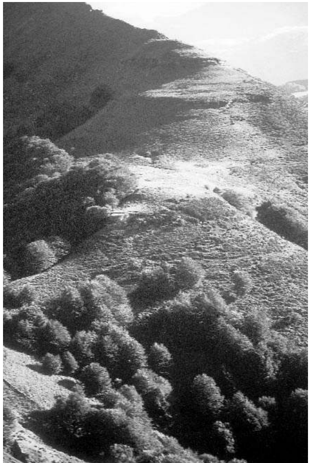
Photo 2. Irabelakaskoa, face Sud. Gradins naturels conduisant au sommet, entrecoupés de banquettes. Au pied du premier gradin, replat entouré d'un fossé.

Qu'il s'agisse d'un site exploité par Annibal ou par les Romains, les Barbares, voire par les Vascons, Irabelakaskoa était un lieu stratégique incomparable aussi bien comme observatoire que