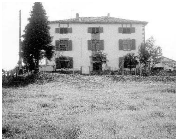
Photo 7. Maison noble d'Iruinea - Lekorne - érigée sur un tertre à deux gradins.

La casa esta asentada sobre un viejo fuerte, situado en un lugar estratégico, al borde del camino Irun-Pamplona, y que ha sido absorbido por los pinares desde unos metros de donde nos encontramos».