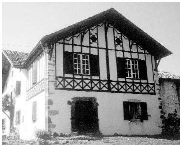
Photo 4. Maison noble d'Iriberry-Bazkazane.