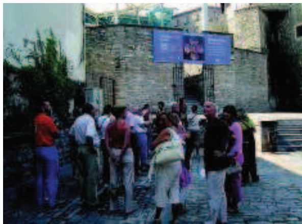
Foto 10. Salida organizada por el Museo de Arte e Historia de Zarautz para conocer la Catedral de Santa María de Vitoria.

La importancia de los restos de Romanización hallados en la Parroquia Santa María la Real pusieron a Zarautz en el mapa de la Romanización de la costa vasca, hasta ese momento encabezado principalmente por Irun y Forua. Esto suponía un paso más en el cambio que en los últimos años habían supuesto los hallazgos arqueológicos en la interpretación de la Romanización del País Vasco. Así, en contra de lo que durante muchos años se había creído, la costa vasca se convertía en una región romanizada. En el caso de Zarautz, el yaci-