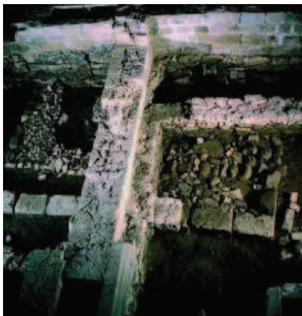
Foto 3. Vista del yacimiento en la Parroquia antes de su musealización.

La comunidad de afectados a la que hacemos referencia es, principalmente, la comunidad católica practicante. Santa María la Real es la Parroquia de Zarautz, lugar donde se celebran la