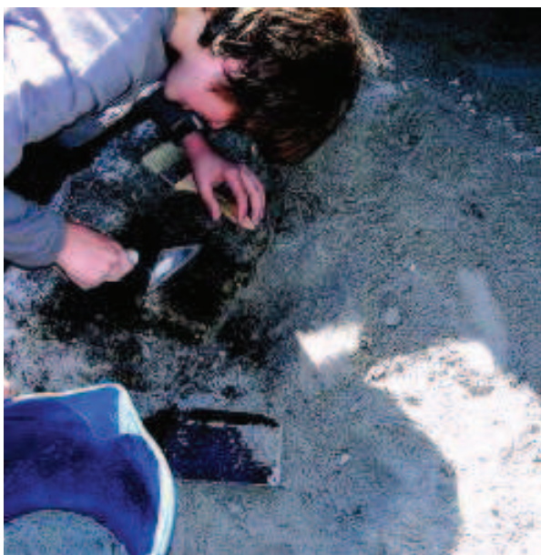
Foto 7. Desarrollo del taller de arqueología.

Esta primera unidad didáctica marcaba ya lo que en un futuro será sello de identidad del Museo de Arte e Historia de Zarautz, que ha trabajado siempre bajo un modelo educativo constructivista, buscado la participación directa del alumno, buscando un método que permita respetar el ritmo de cada individuo y que aporte libertad a la hora de trabajar.