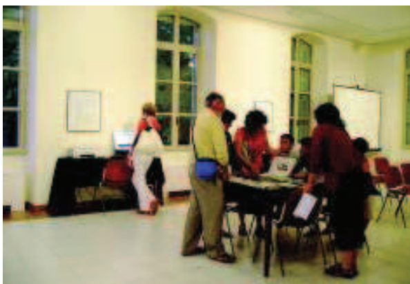
Foto 13. Sala-taller de la exposición Zarautz en tu recuerdo .

recuperar la memoria histórica de cada lugar, impulsando la participación ciudadana. El objetivo es que los particulares realicen narraciones digitales que podrán colgar en una web, eje del proyecto Museos Vivos . Ésta dará la oportunidad de crear una comunidad entre todas las personas interesadas en el patrimonio y la recuperación de la memoria histórica, dando lugar a una memoria colectiva. La página web constituiría, por tanto, un museo vivo donde se puede participar libremente, aportando a la historia desde un punto de vista personal.