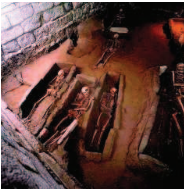
Foto 1. Vista del yacimiento en la Torre Campanario antes de ser musealizado

Desde un principio tuvimos claro el eje sobre el cual debía de girar nuestro proyecto, las aptitudes de los sujetos a quienes nos íbamos a dirigir. Se crearon materiales didácticos dirigidos a escolares de 5º y 6º de Enseñanza Primaria para el conocimiento de la historia de Zarautz. La oferta dirigida a los alumnos de primaria se ejecutó en