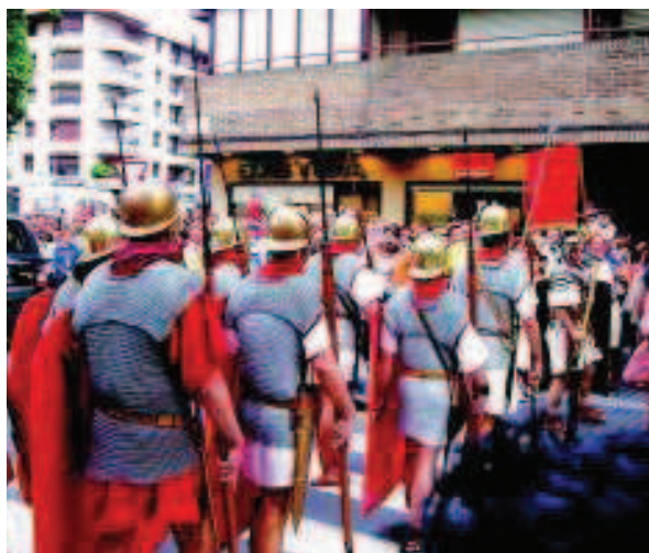
Foto 12. Demostración de las técnicas militares empleadas en época del Alto Imperio Romano.

La exposición, que tomó por nombre Zarautz en tu recuerdo , supuso una novedad ya que el Museo pidió la colaboración de la ciudadanía para completar los contenidos que se iban a exponer en la misma. Una vez más, la institución buscaba la implicación y la participación de la gente, que respondió de manera extraordinaria a la hora de ceder sus objetos, testimonios, docu-