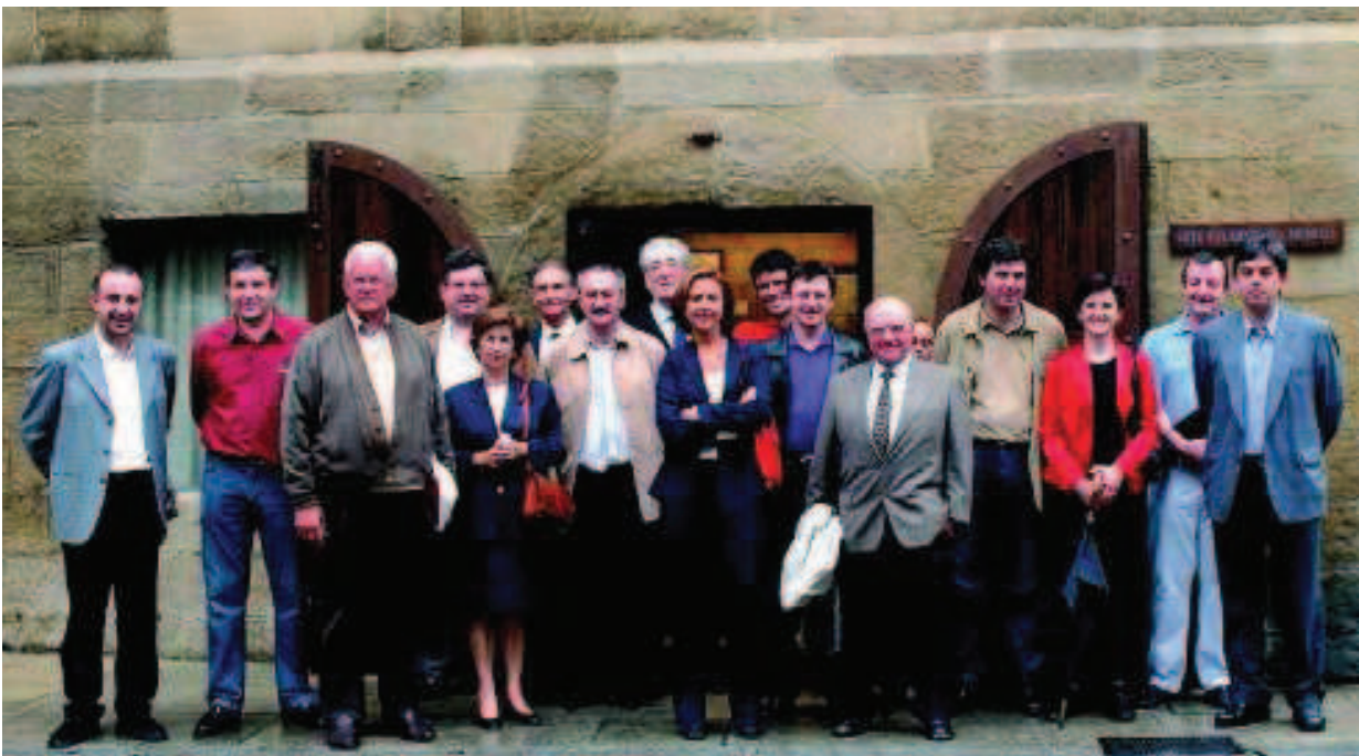
Foto 4. Inauguración del Museo de Arte e Historia de Zarautz.

El Museo se inauguró en la Torre Campanario de la Parroquia Santa María la Real con apenas cuatro salas de 30 m 2 . La primera exposición exhibía una muestra de piezas y elementos referentes a la historia de Zarautz. Mediante bloques temáti-