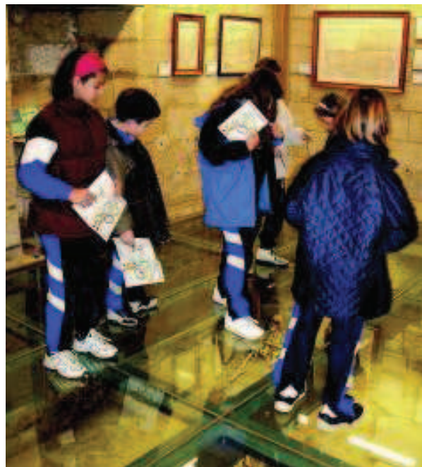
Foto 2. Desarrollo de la actividad En busca del tiempo .

En busca del tiempo , es un juego de pistas temático que inicia su cronología con los primeros pobladores de Zarautz, presentes en la necrópolis de la Torre Campanario (Foto 2), y hace especial hincapié en la concesión de la Carta Puebla a la Villa de Zarautz en 1237. A partir de este momento histórico se hace un repaso de los acontecimientos más relevantes de la historia de la Villa. Un personaje llamado "Txirri", un correlimos común, se encarga de dirigir la actividad solicitando colaboración a los alumnos para conservar parte de su ecosistema, ya que los habitantes de Zarautz lo han reducido a una pequeña porción de la playa de Zarautz, debido a la presión demográfica que ha sufrido esta zona costera a lo largo de la historia.