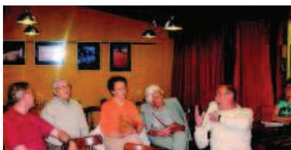
Foto 14. Participantes en uno de los talleres organizados dentro del programa Zarautz en tu recuerdo .

El Museo de Arte e Historia de Zarautz ha crecido mucho en los últimos años: ha crecido en tamaño al incorporar las nuevas zonas excavadas, ha crecido en horario de apertura al público, ha crecido el número de visitantes (Ver Anexo I), ha crecido su oferta... pero, sin embargo, su infraestructura no ha crecido. Para que un proyecto sobreviva no puede suceder que el contenido