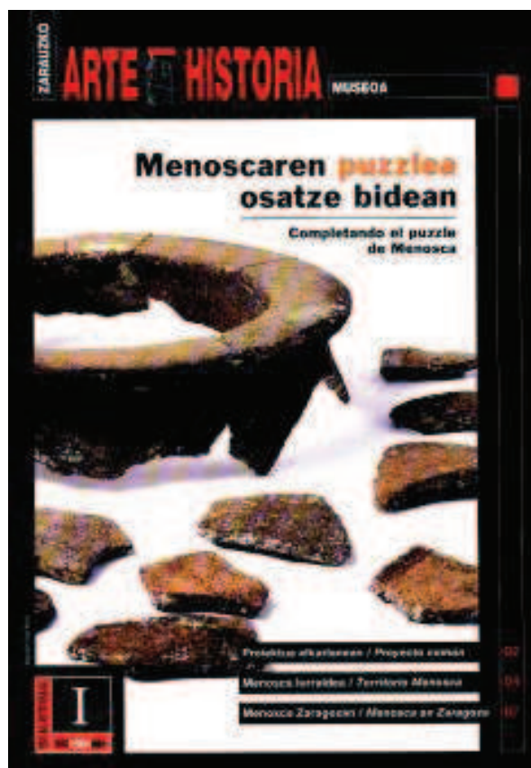
Fig.1. El boletín publicado por el Museo de Arte e Historia de Zarautz.

El año 2005 es un año clave en la evolución del Museo de Arte e Historia de Zarautz porque se