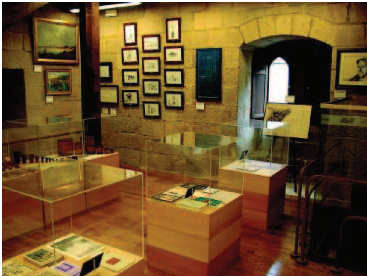
Foto 5. Interior del Museo de Arte e Historia de Zarautz.

cos se hacía un repaso a las Guerras Carlistas, el ordenamiento jurídico de la Villa, la cartografía, el urbanismo, la educación, la literatura, la heráldica local, las infraestructuras o el arte (Foto 5). Este último cobraba una mayor relevancia, ya que el piso superior se dedicaba, exclusivamente, al patrimonio artístico local y al espectacular mecanismo del reloj de 1910 que, ininterrumpidamente, marca el devenir del tiempo desde lo más alto de la Torre. Sin embargo, los cimientos de la Torre protegían uno de los elementos más espectaculares de toda la exposición: la necrópolis medieval situada bajo los cimientos del edificio.