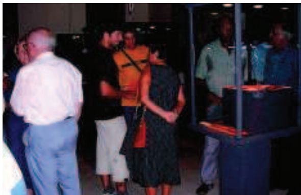
Foto 6. Inauguración de la exposición sobre los hallazgos arqueológicos de Santa María la Real.

Mientras la exposición mostraba los resultados de la excavación de una manera didáctica, más cercana al público en general, el 23 de octubre se presentaban los resultados preliminares de la investiga-