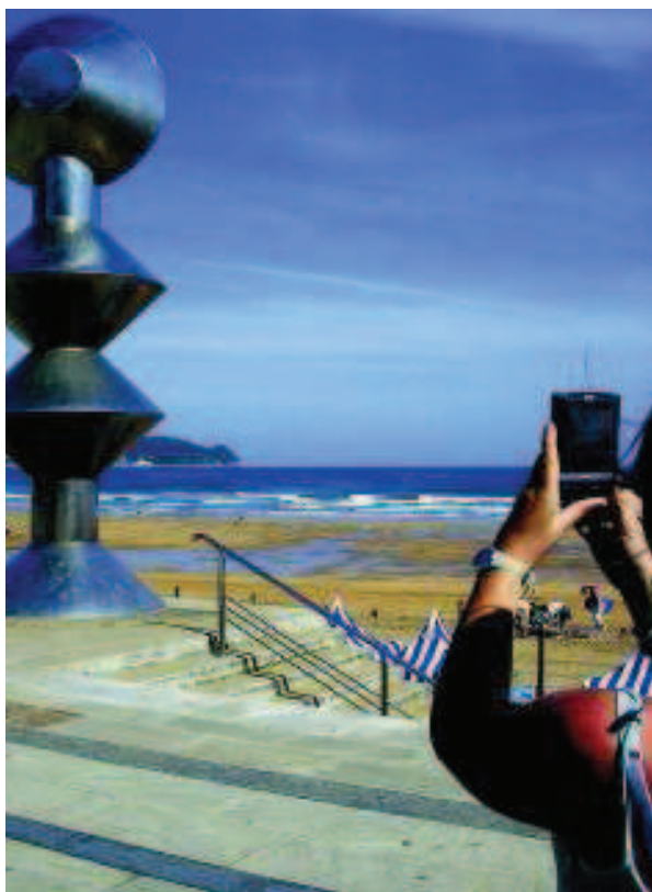
Foto 9. Desarrollo del programa educativo De las esculturas de calle al museo .

Paralelamente a estos 3 itinerarios, Berril@b diseñó un mapa cartográfico de Zarautz denominado Zarautz en tus manos 3 , en el que se destacan y se da información sobre los lugares más emblemáticos del patrimonio de la Villa y alrededores. Este mapa está diseñado para poder usarlo vía on-line o mediante la versión descargable para soportes móviles, lo cual permitiría utilizarlo sobre el propio terreno. La idea es que, mediante la señalización en el mapa de los puntos más destacados y la información que se aporta sobre los mismos, el usuario pueda crear una visita del territorio “a la carta”.