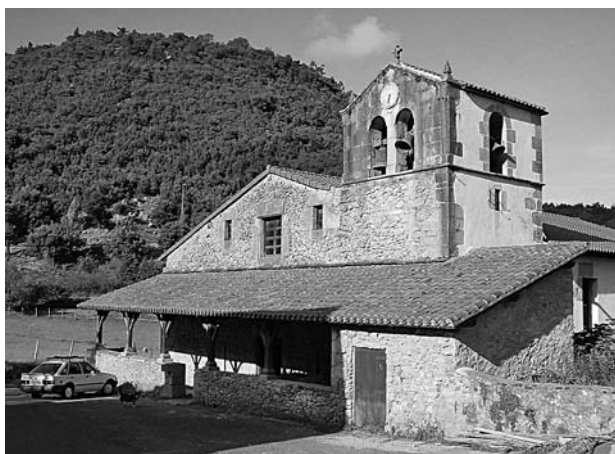
Lámina 1.- Iglesia de San Andrés.

Históricamente todos los municipios guipuzcoanos del valle del río Deba, excepto la propia villa de Deba situada en la desembocadura y la de Mutriku, algo desgajada del propio valle, han pertenecido a la diócesis de Calahorra 6 .