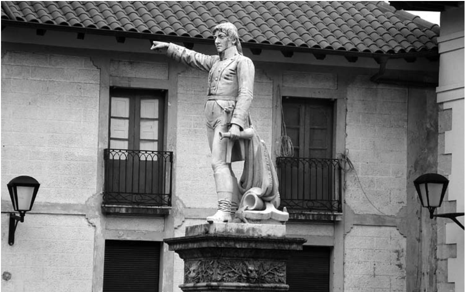
Lámina. 6- Estatua de Churrucua en su localidad natal, erigida en 1865.

diferentes y la única chica, Vicenta, continuó viviendo de alquiler en Arrietacua, hasta que la familia Churrucua la adquiere en 1847 después de varias vicisitudes 16 .