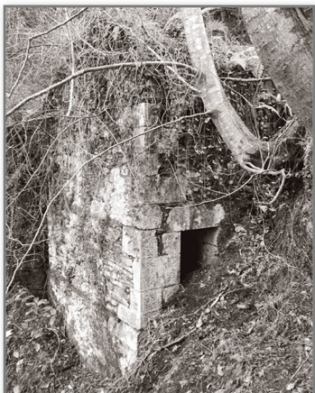
Zona lateral con el pequeño hueco de acceso.