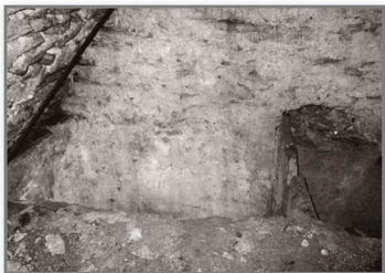
Depósito de 1800 litros.