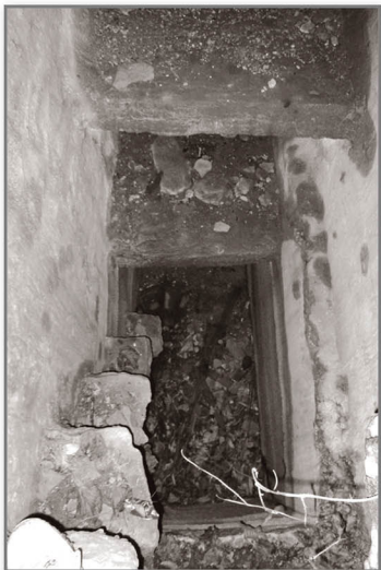
Peligrosos peldaños que descienden hacia el tercer depósito.