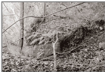
La parte trasera se eleva 1 metro sobre el terreno.