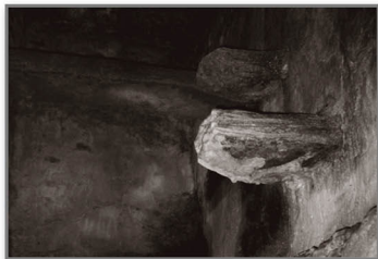
Peligrosos peldaños de subida.