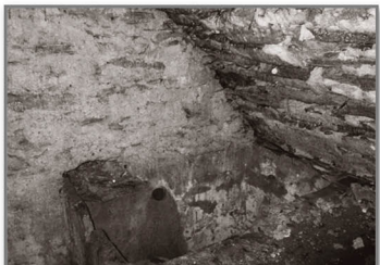
Depósito de 1700 litros.