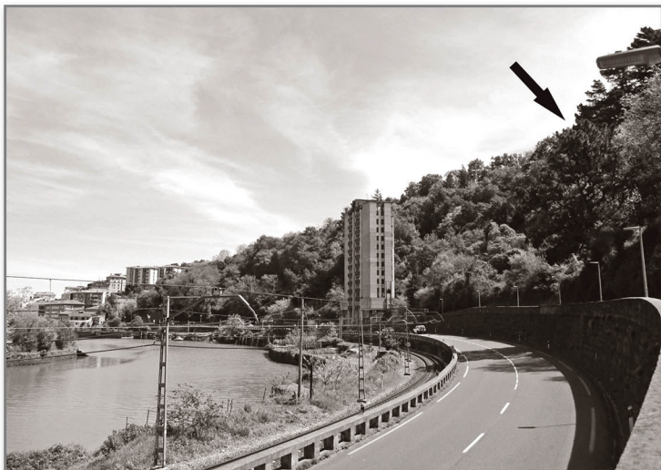
La situación del depósito de Errekatxo se indica con una flecha.

A mediados del siglo XIX se agudizó el problema de abastecimiento de agua potable a la población debarra debido al aumento de gente que en verano acudía a veranear a la localidad. El Ayuntamiento invirtió en la mejora para la captación, depuración y abastecimiento mediante una suscripción pública entre el vecindario, acometiéndose las obras en 1871 (1).