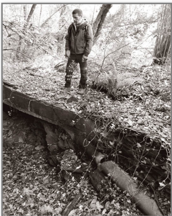
Antigua tubería de conducción de agua potable.

Se trata de un depósito decantador para eliminar la turbidez del agua y que desde ahí llegase a la fuente un agua ya clara, apta para beber según las condiciones de aquella época, en la que no se realizaban controles de ningún tipo. Edificio de planta ligeramente rectangular, 3,6 x 3,30 m, la pared del lado más amplio tiene la forma tronco-piramidal con remate curvo en la parte superior. Las esquinas del depósito y el recerco de la pequeña puerta de entrada están realizados con buena piedra sillar, de caliza y los paños de los muros son de mampostería. La puerta, de la que aún mantiene sus goznes incrustados en la piedra, tiene un hueco de 76 cm de ancho y 90 cm de altura, suficiente para poder entrar y que haya algo de luz dentro. El acceso actual a su interior no es aconsejable si no se toman las debidas precauciones de seguridad e iluminación. Nada más entrar se abren 5 peldaños a la izquierda que descienden y otros 5 peldaños a la derecha ascendentes, embutidos en la pared y que sobresalen muy poco de los muros, unos 30 cm y de forma irregular. En la parte de la derecha, según se entra, están fabricados los dos depósitos para el agua, que de acuerdo a las cotas que se han tomado tienen una capacidad de 1800 y 1700 litros respectivamente, uno más profundo que otro. El muro interior de carga de estos dos depósitos tiene una anchura de 55 cm y no obstante enfrente de la entrada existen unas losas