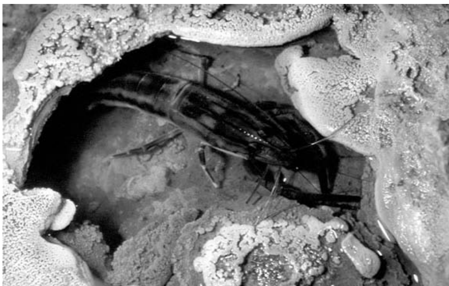
Camarón de agua dulce en un gour de la cueva El Zumbador, estado Falcón. Poco se conoce de este grupo en ambientes cavernícolas, aunque a diferencia de los cangrejos, no han sido hallados individuos evidentemente troglomorfos.

DECAPODA. Las especies troglófilas de cangrejos Pseudohelphusidae son comunes en las cuevas venezolanas, particularmente Eudaniella garmani , en Anzoátegui y Monagas, Chaceus motiloni , Chaceus turikensis e Hypolobocera bouvieri angulata , en la Sierra de Perijá. Chaceus caecus , de varias cavernas en las cuencas del Guasare y Socuy, resultó el primer cangrejo stygobio para América del Sur. Existe además una indescrita especie stygobia de Eudaniella de la sima de Narciso, en el karst de Mata de Mango, y otra probable de la Cueva de Quijano, en Caripe. Diversas especies de camarones de agua dulce, troglógenos y troglófilos, han sido también observadas en los ríos subterráneos de Birongo (Miranda) y otros karsts. Probablemente de trate de palaemónidos Macrobrachium o afines. Pero este grupo aún no ha sido estudiado.