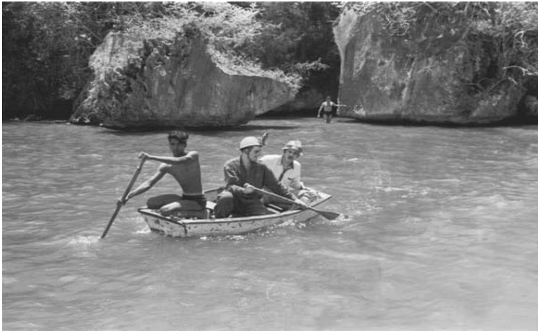
Espeleólogos durante la exploración del macizo Kárstico de Mallorca en la costa oriental del estado Falcón.