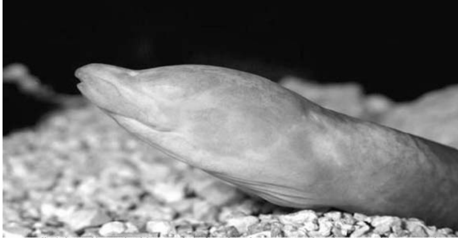
Detalle de la porción anterior del cuerpo de Synbranchius cf. marmoratus colectado en cueva del Agua, estado Anzoátegui. Cabe señalar que el ejemplar tenía una longitud de 69 cm. La fotografía fue tomada a un individuo en cautiverio.

Formas troglófilas y troglógenas de peces son comunes en los ríos subterráneos de cuevas venezolanas; entre otras han sido citadas: Creagrutus hildenbrandi (Characidae), Lebiasina erythrinoides (Lebiasinidae), Pimelodella chagresi odynea (Pimelodidae), Ancistrus brevifilis bodenhameri y Lasiancistrus maracaiboensis (Loricariidae), Trichomycterus banneai maracaiboensis y T. emanueli (Trichomycteridae).