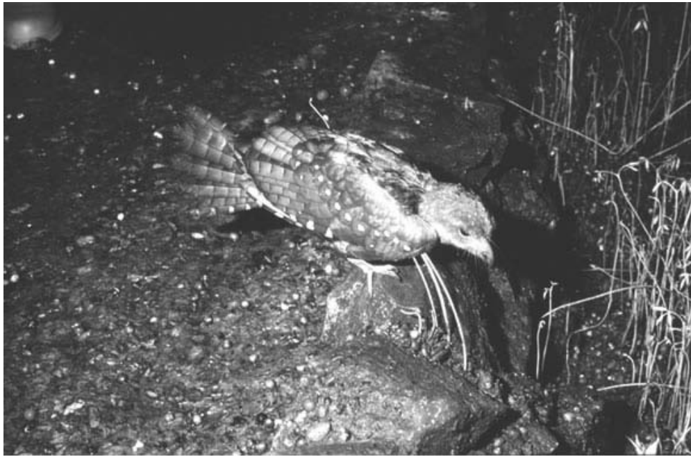
Juvenil de guácharo ( Steatornis caripensis ). A un lado se observan semillas germinadas provenientes de la alimentación de los pájaros.