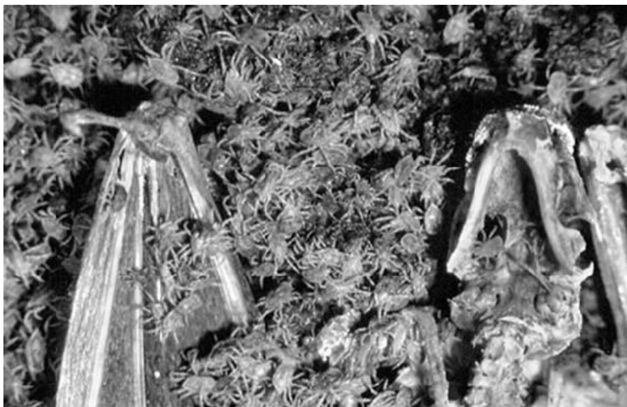
La fauna asociada al guano suele ser diversa y abundante en las cuevas tropicales. Sin embargo, en la cueva Ricardo Zuloaga la dominancia de ácaros es por demás extraordinaria.