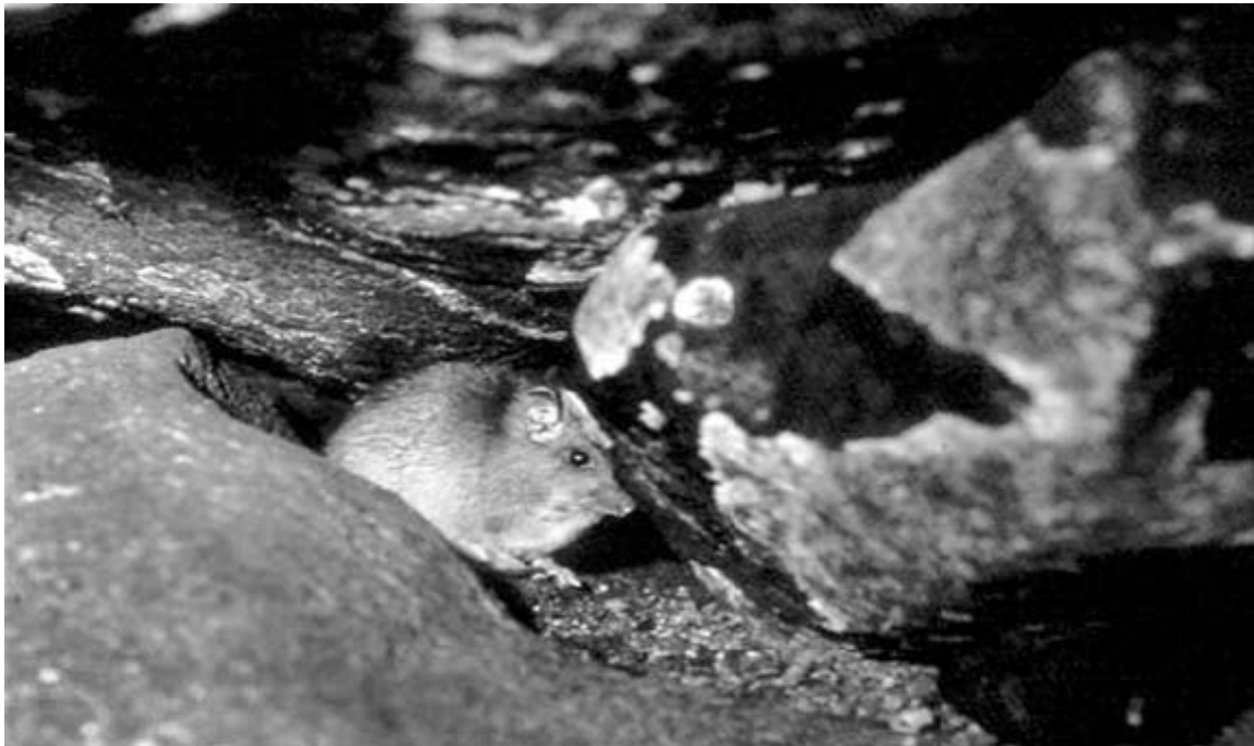
Ratón mochilero ( Heteromys anomalus ) en una cueva de la región de Mata de Mango.

Adicionalmente ha sido reportada la presencia eventual de grandes roedores, como la lapa Agouti paca paca (Agoutidae) y el picure Dasyprocta aguti (Dasyproctidae); también de marsupiales, como los rabipelados Didelphis marsupialis , D. azarae (Didelphiidae), musarañas Cryptotis thomasi , Cryptotis sp. (Soricidae); y diversos carnívoros Felidae: el jaguar Panthera onca , el cunaguaro u ocelote Leopardus pardalis , y otros gatos de monte o tigrillos como Leopardus tigrina y L. wiedii . La mayoría de los felinos frecuenta las bocas de cuevas, abrigos, cancameras y otras anfractuosidades rocosas, donde a menudo se refugian o reproducen, pero también ha sido constatado el ingreso del cunaguaro a cuevas con guácharos, donde acude para alimentarse de roedores, pichones de guácharos y otros vertebrados.