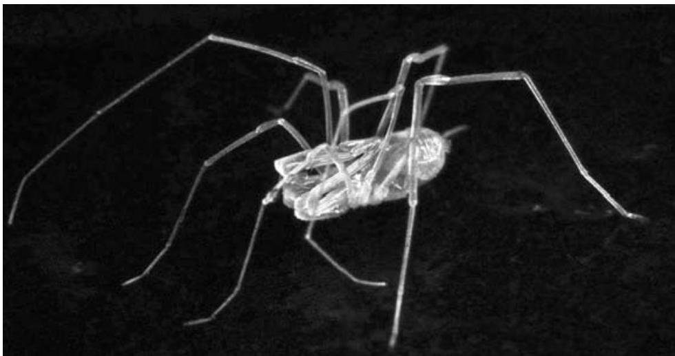
Opilión troglomorfo evidenciando estructuras largas y estilizadas, depigmentación y reducción del aparato ocular.

ISOPTERA. Termitas no identificadas de la familia Termitidae han sido halladas en muestras de guano de la Cueva del Guácharo. Probablemente existan en muchas otras simas y cuevas con depósitos de madera muerta.