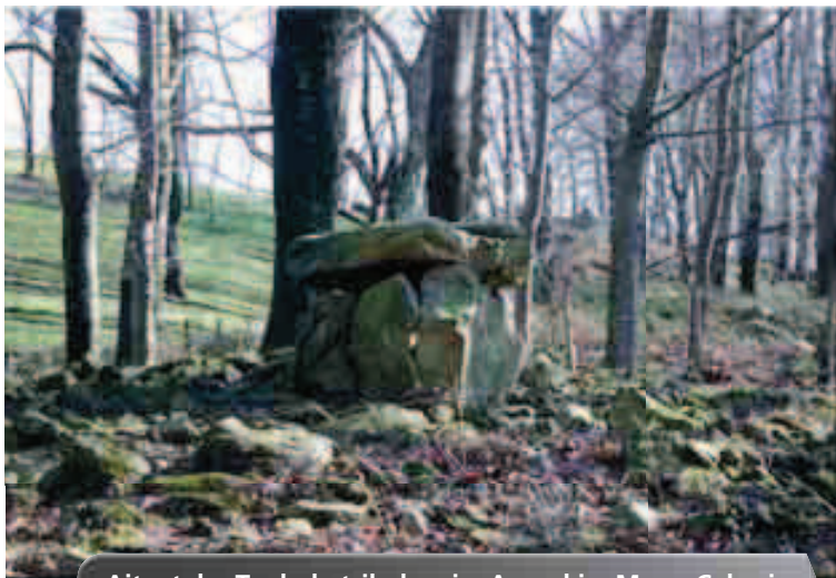
Aitzetako Txabala trikuharria.

Orain arte lortutako datu berrien artean, Mariolako harkutxa aurkitzea eta Berrozpingo parkean aztarna multzo bat jasotzea aipatu ditzakegu. Mariola P.M. Soraluçek aurkitu zuen 1919an, Astigarraga eta Erreteriarren arteko mugan, baina bere ustez cromlech edo mairubaratza zena gaur arte ahaztua izan da. 2008 eta 2009an lekua induskatu genuen historiaurreko egitura zela egiaztatuz, nahiz eta mairubaratza ez izan, harkutxa baizik. Bestaldetik, Berrozpinen sukarrizko piezak azaltzen zirela jakin genuen Antxon Díez-i esker, eta miaketa sistematikoak egin ondoren 100 piezatik gora jaso ditugu.