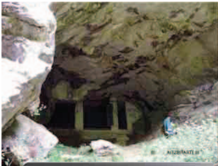
Aitzbitarteko kobazuloak. Argazkiak: Jesús Tapia

E rreenterian Historiaurreko aztarnen ezagutza aspaldiko kontua da, Gipuzkoako lehenbiziko indusketa arkeologikoa Aitzbitarteko (Landarbaso) kobazuloetan egin baitzen 1892an. Orain arte ezagutzen ditugun Historiaurreko aztarnak, ordea, ez dira oso ugariak, eta bi multzotan banatu daitezke: