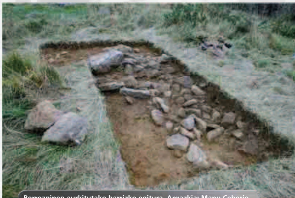
Berrozpinen aurkitutako harrizko egitura.

Azkeneko kanpainan (2011) kata bat hasi dugu Berrozpinen, lur azpian piezak edo bestelako aztarnak aurkitu nahian. Hasieran 2x2 metroko laukia industean, harrizko blokez egindako egitura bat azaldu zen, eta hura aztertu ahal izateko laukia 14 metro karraturaino zabaldu dugu. Orain arte ikusi dugunez, egiturak trikuharri baten tumulua ematen du, hilobia estaltzeko lur eta harriz osatutako multzoa, gainean lauza handi bat daukala. Oraingo zehaztasun guztiz ez bada ere, trikuharri berri bat izan daitekeela esan dezakegu, eta datorren kanpainetan gai hau argitzen saiatuko gara.