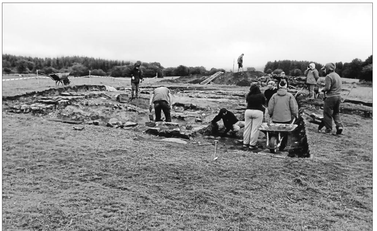
En los trabajos participa un equipo internacional de arqueólogos, gracias a un convenio entre Aranzadi y el MOLA inglés. GARA