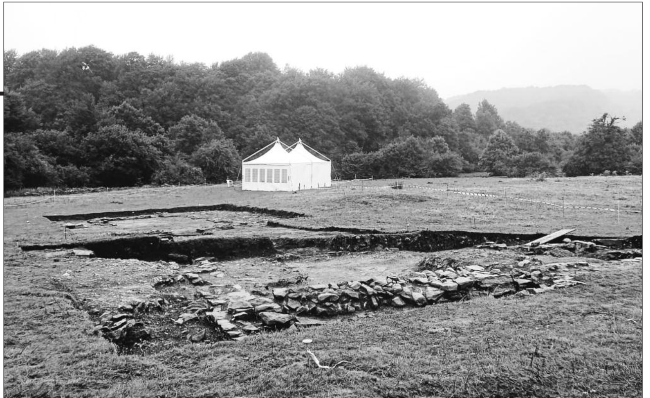
Las excavaciones, interrumpidas en ocasiones por la fuerte lluvia, han dejado a la vista gruesos muros de la ciudad. Iñaki VIGOR

El Gobierno navarro acordó el pasado miércoles conceder una subvención de 100.000 euros al que denomina "Proyecto Iturissa", que será gestionada por el Ayuntamiento de Auritz.