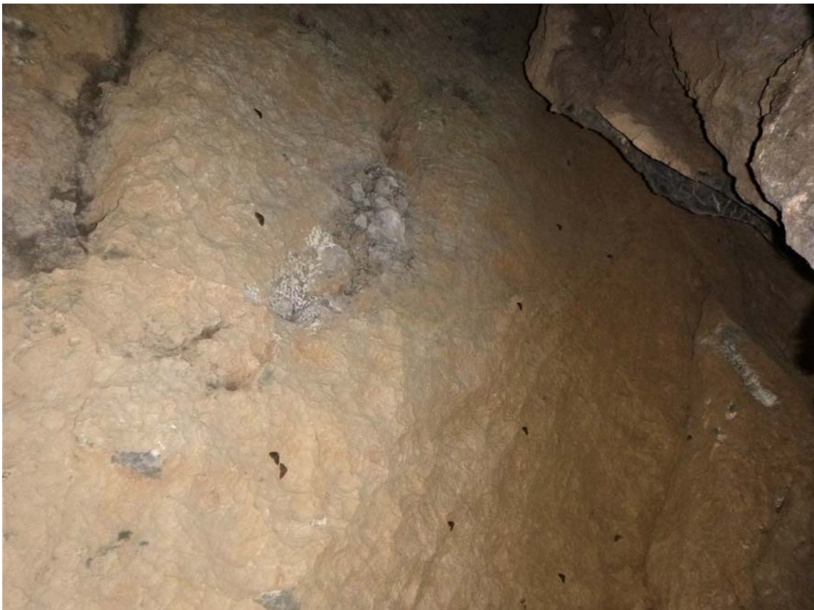
Figura 19. El borde de la sima interceptado por la galería de mina (arriba). La sima natural se prolonga +5 m en vertical hacia arriba (debajo). Se aprecian algunos lepidópteros en la pared de roca caliza.