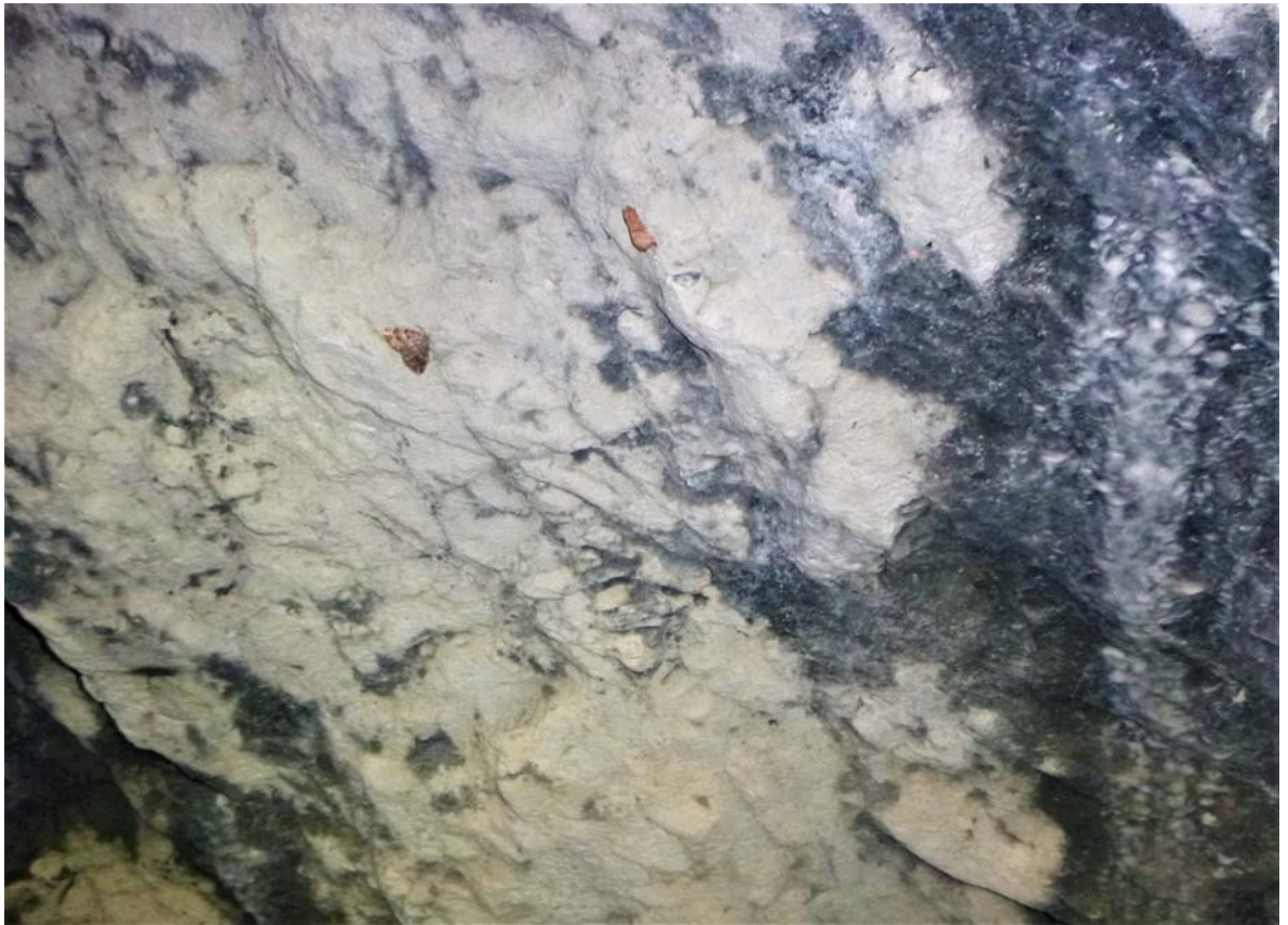
Figura 06. Ejemplares de lepidópteros: Aglais io (arriba), Triphosa dubitata y Scoliopteryx libatrix (debajo).