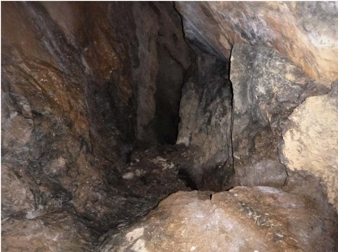
Figura 20. Primer escalón de la sima de -80 m, con un paso estrecho, y continuación de mayor amplitud.