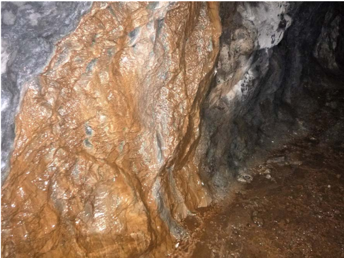
Figura 14. Diversos aspectos de la galería de mina, con algunos films de espeleotemas.