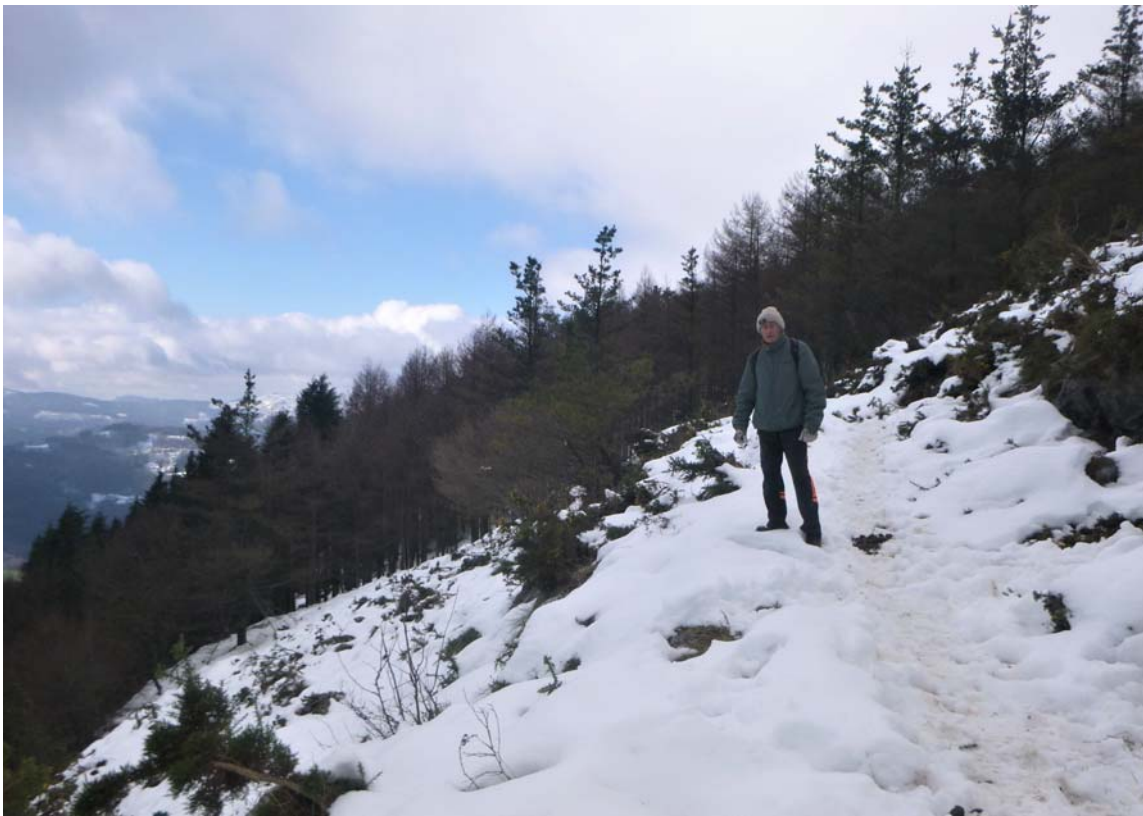
Figura 12. Ruta de aproximación a la mina, con nieve.