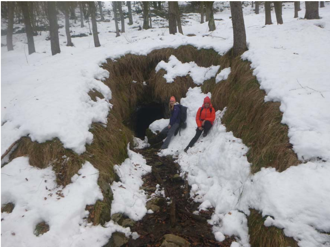
Figura 23. El collado de Zelatun y el monte Ernio al fondo (arriba). Alcanzando la boca de la mina (debajo).