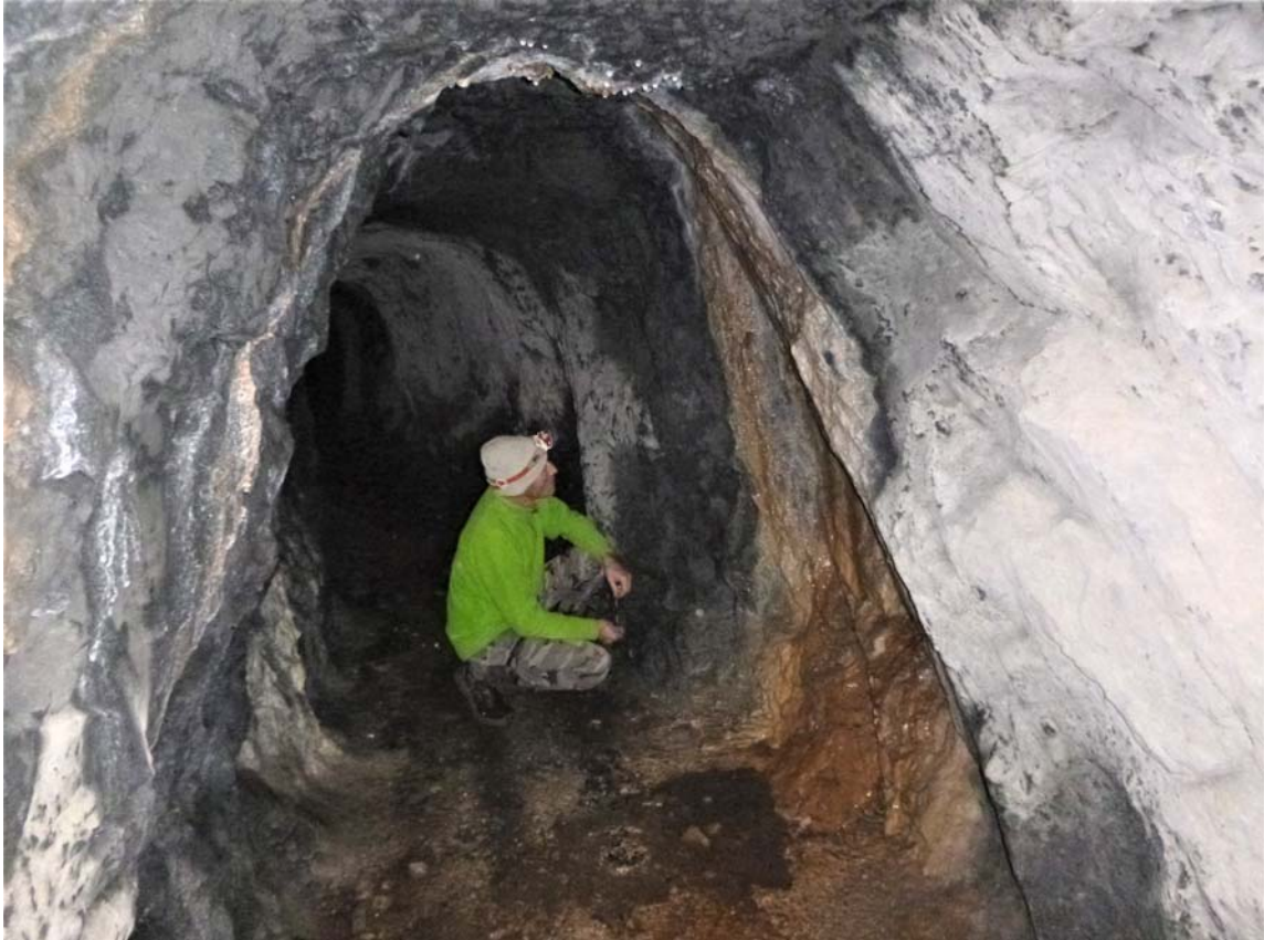
Figura 07. Espeleotemas de calcita, con la boca al fondo (arriba) y coladas de calcita con trazas de hemimorfita y oxi-hidróxidos de hierro (debajo).