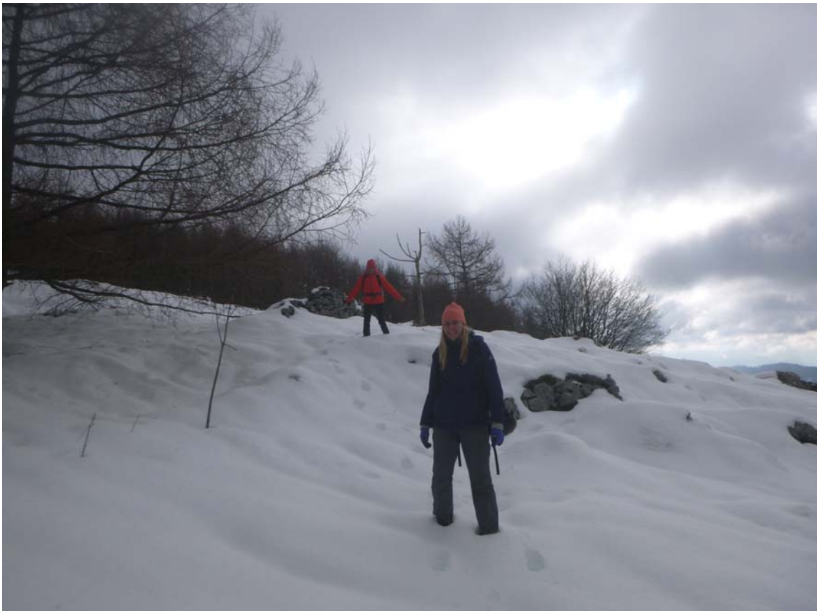
Figura 11. Exploraciones en época invernal, tras fuertes nevadas.