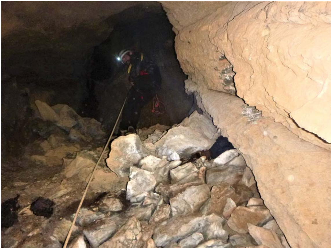
Figura 21. Segundo tramo de la sima de -80 m, con bloques inestables entre los tramos verticales. El terreno resulta muy expuesto porque cualquier roce de la cuerda o del explorador podría producir derrumbes.