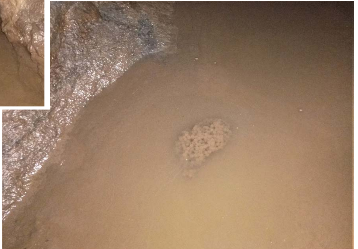
Figura 05. Ejemplares de Rana temporaria y puesta de huevos en el fondo del segundo estanque.