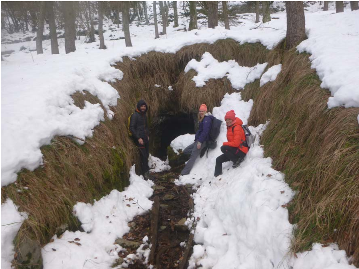
Figura 26. Alcanzando la zona de entrada inundada cercana a la boca y vista de la boca desde el exterior.