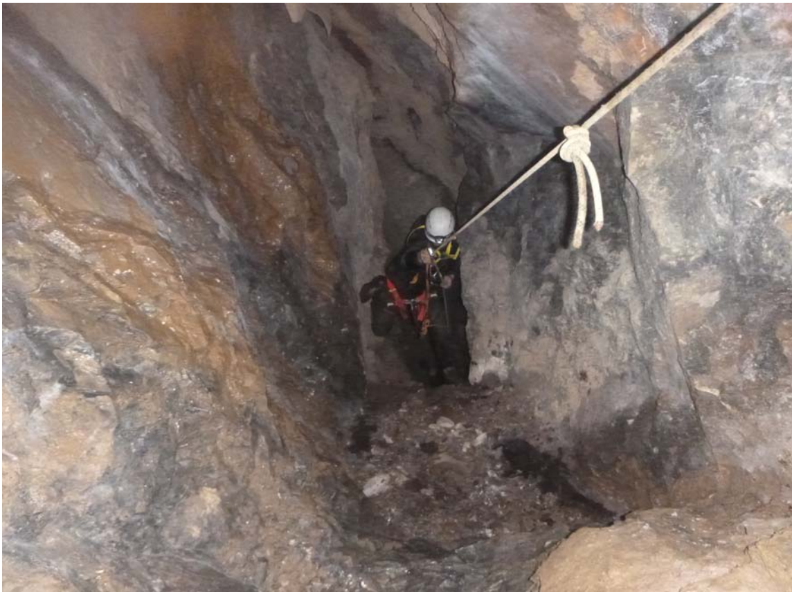
Figura 24. Ascenso de la sima en jumars. Aquí, alcanzando el tramo de unión de las dos primeras cuerdas de 20 m.