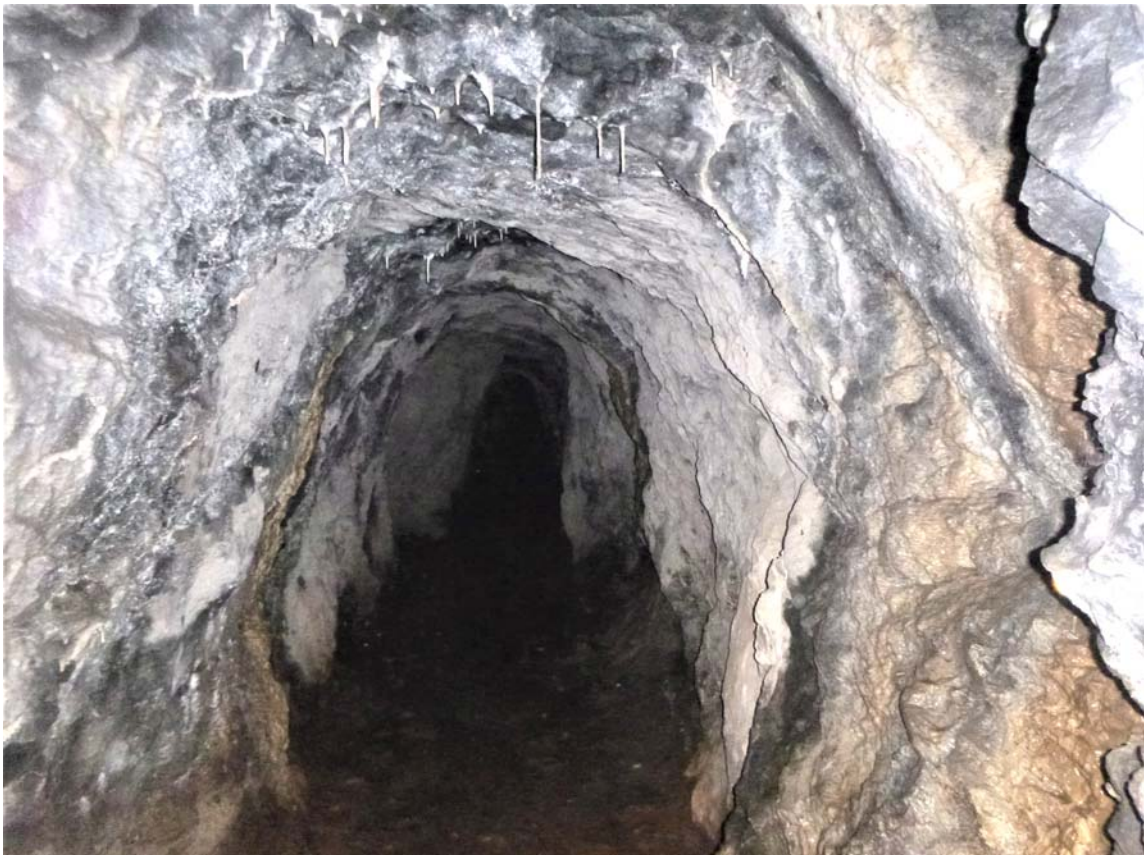
Figura 04. Pasos en oposición sobre los estanques de la zona de entrada y pequeñas espeleotemas isotubulares de calcita en la bóveda de la galería de mina.