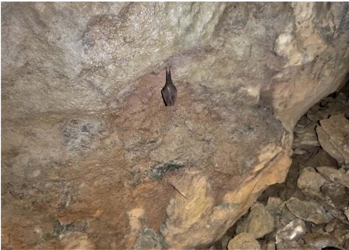
Figura 09. Detalles de quirópteros Eptesicus serotinus (arriba) y Rhinolophus hipposideros (debajo).