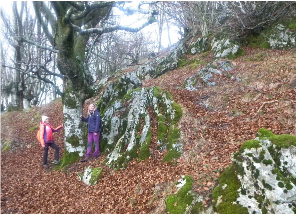
Figura 02. El relieve kárstico de superficie en la zona de Bordatxo (flanco Sur del Gazume, durante las primeras prospecciones, con lluvia.