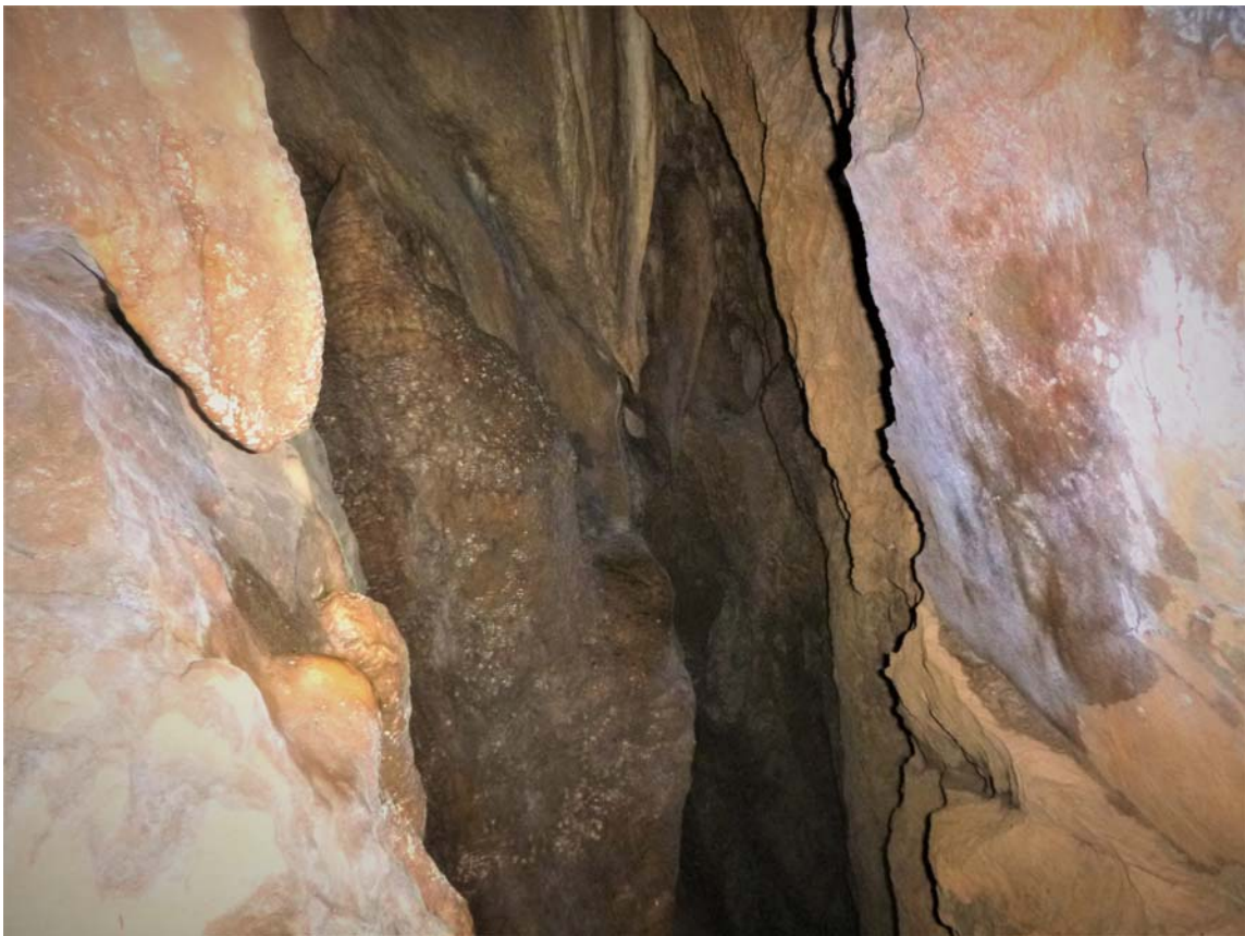
Figura 22. Inicio de la última vertical, cota -35 m, donde la sima gana en amplitud y presenta numerosas espeleotemas en sus paredes.