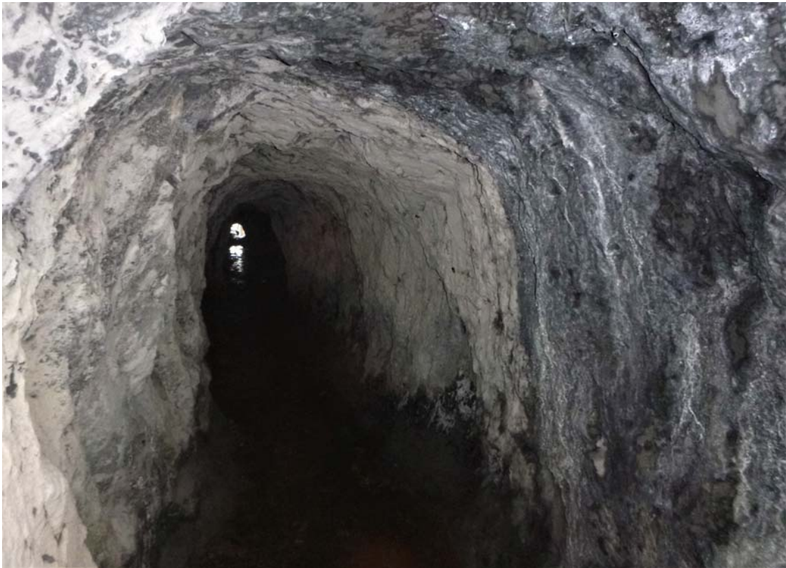
Figura 25. Recogiendo equipos, tras explorar la sima, y de regreso por la galería de mina horizontal hacia la boca.