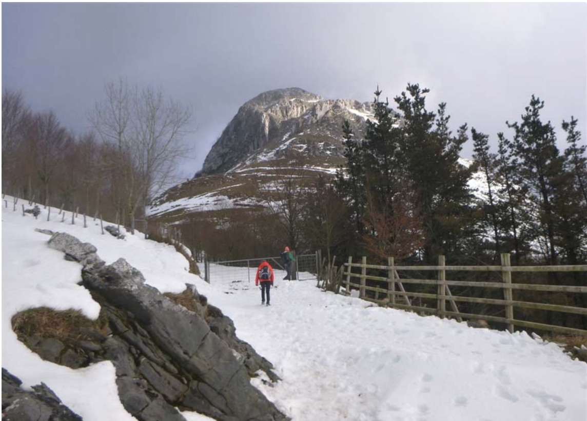
Figura 28. Regresando a campo través hacia el collado de Zelatun, con el Ernio al fondo.