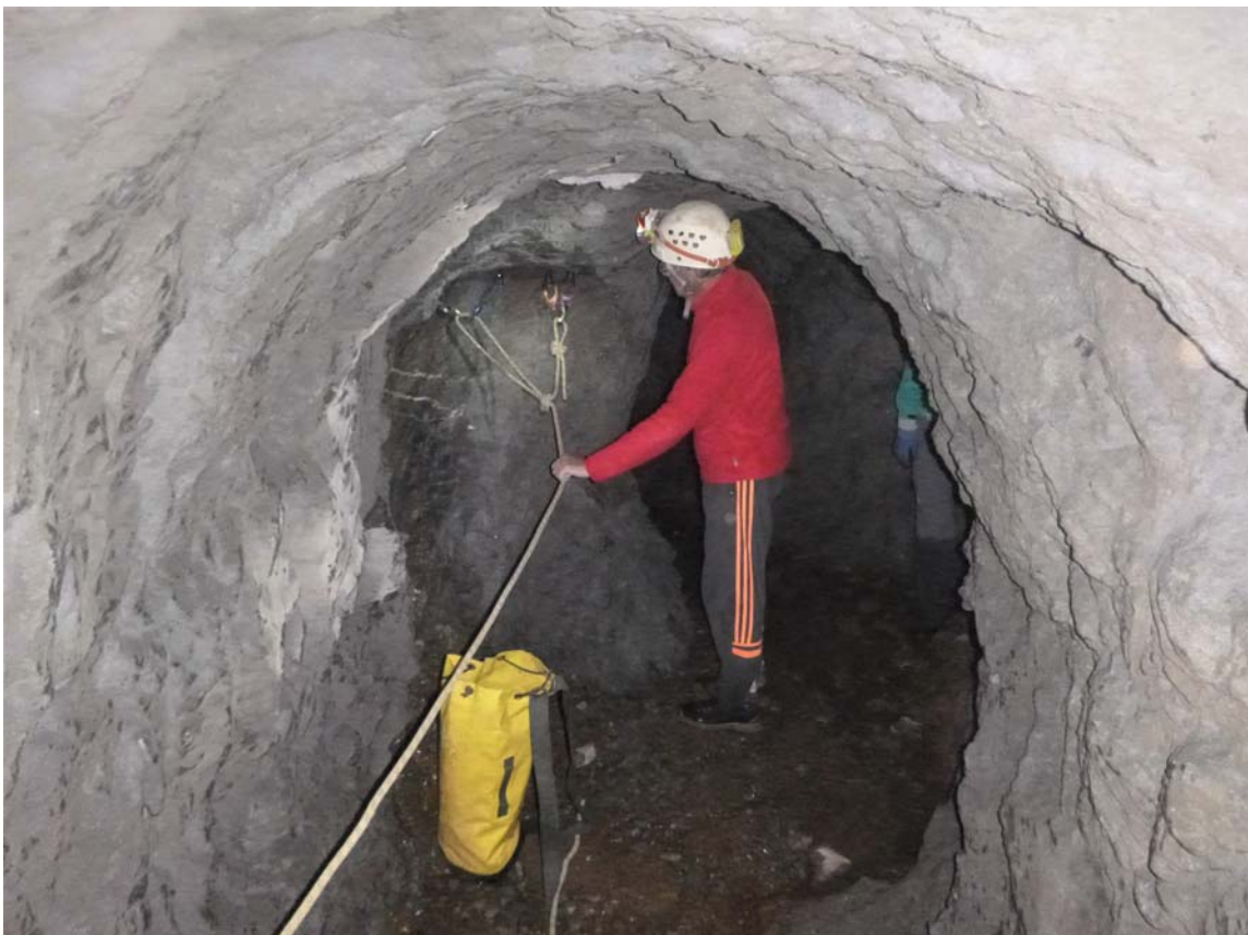
Figura 18. Equipando con friends el anclaje principal de la cuerda, para descender a la sima. Resulta más rápido y eficaz que instalar clavos de expansión perforando la dura roca.