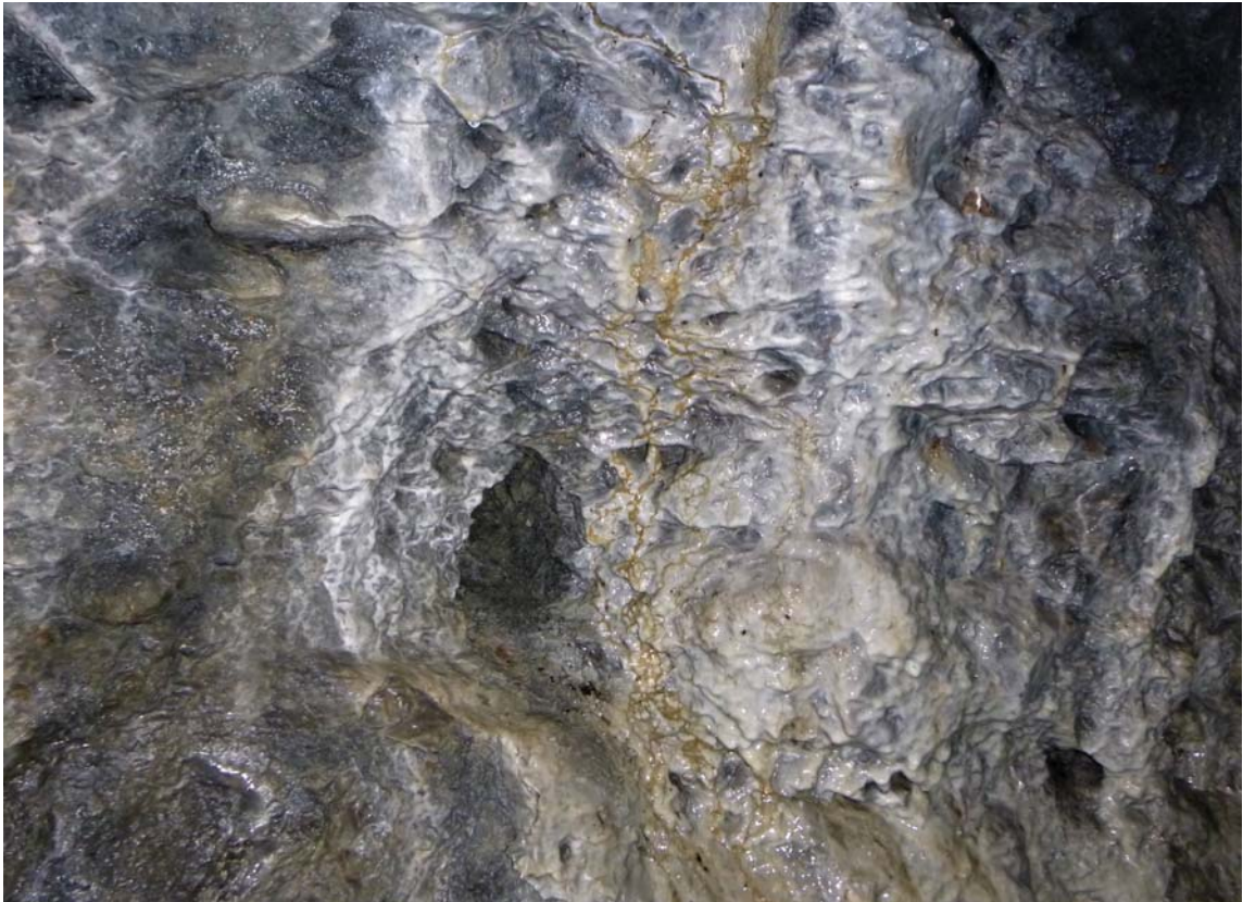
Figura 08. Diversas coladas de calcita con trazas de hemimorfita y oxi-hidróxidos de hierro en la galería de mina.