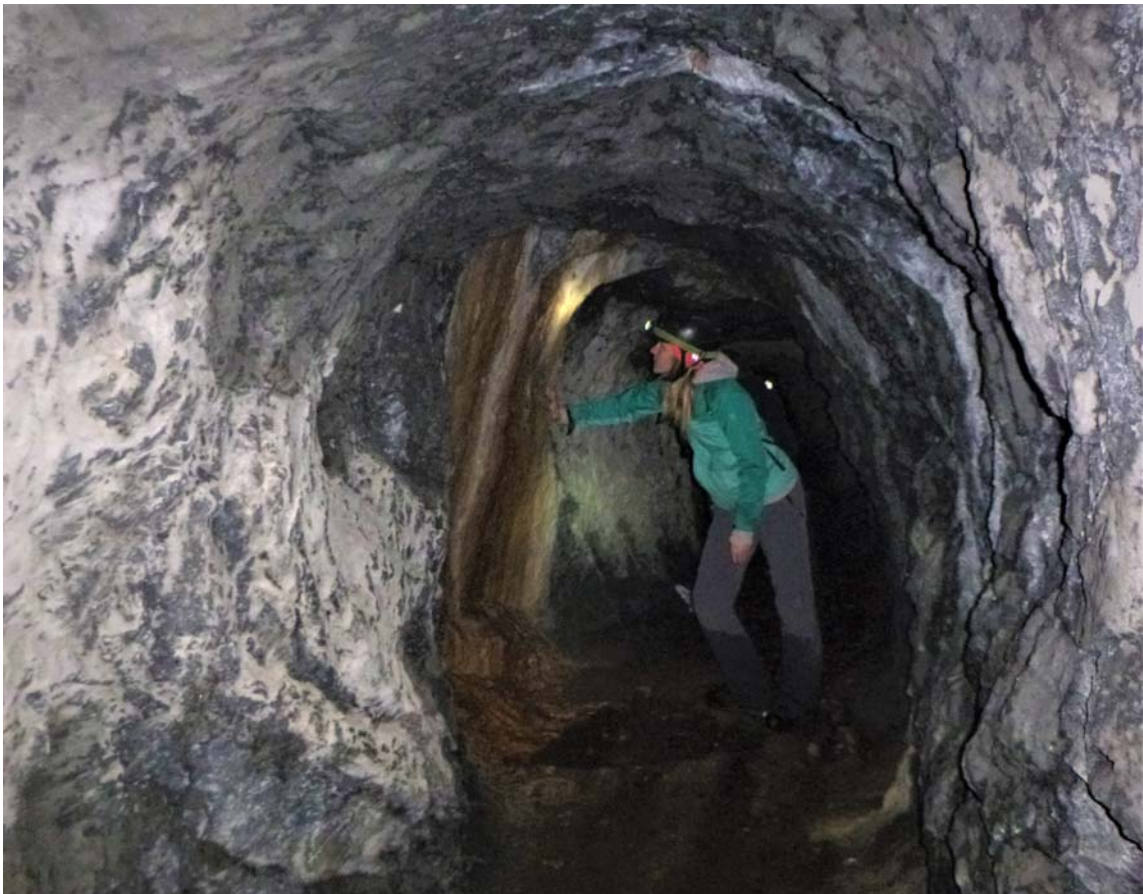
Figura 15. Detalles de tramos rectilíneos en la galería minera, con algunas espeleotemas en sus paredes.