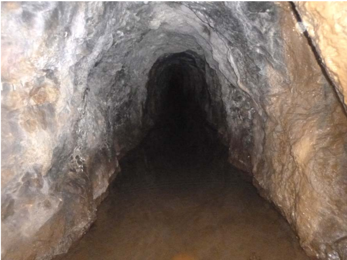
Figura 03. Zanjón en la ladera y boca de la mina-sima Bordatxo 01, con los primeros tramos inundados.