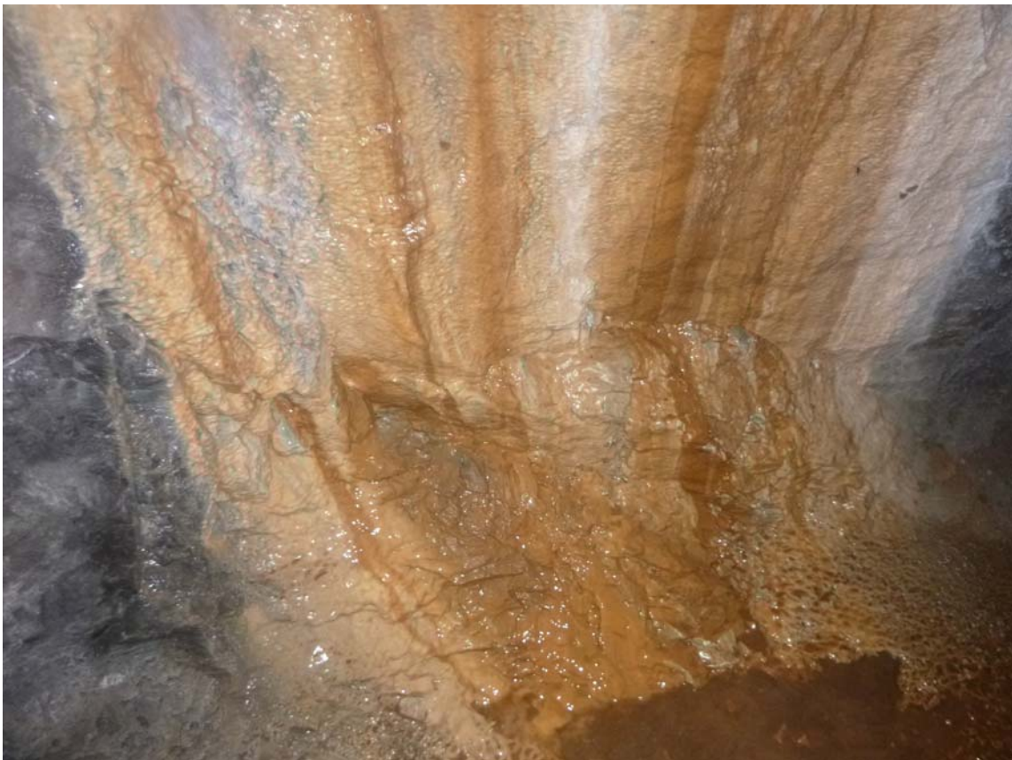
Figura 16. Detalles de coladas estalagmíticas parietales, con microgours en sus bases. La calcita se presenta teñida de colores ocre por trazas de hemimorfita, smithsonita y oxi-hidróxidos de hierro.