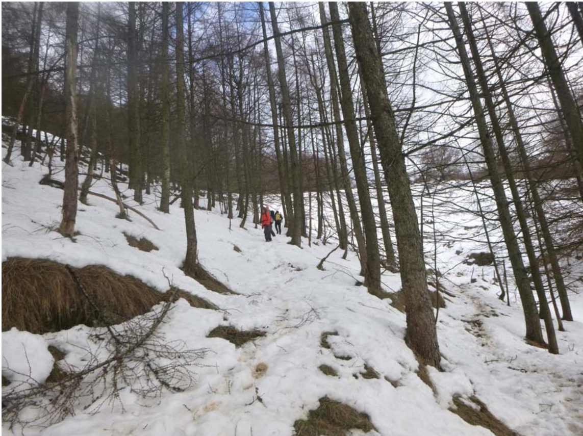
Figura 27. En la ladera Sur de Gazume, bajo el nivel de la mina Bordatxo, no encontramos otras minas, cuevas o probables accesos al nivel inferior de la sima de -80 m. De haber existido deben haber colapsado.