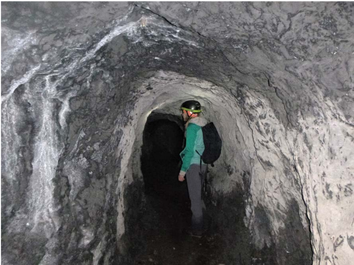
Figura 17. Llegando a los codos del fondo de la galería minera, en la proximidad de la sima.