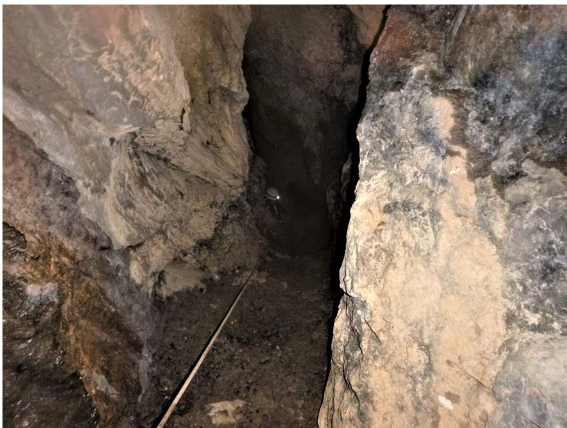
Figura 23. Últimos tramos de la sima de -80 m, con rampas de bloques en precario equilibrio.