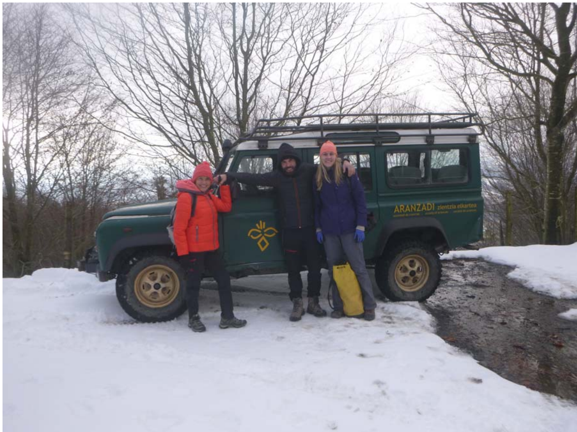
Figura 10. Otra de las salidas, tras fuertes nevadas. El equipo con el land-rover en el collado de Zelatun.