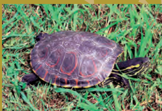
Trachemys scripta scripta