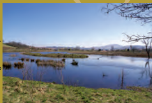
Plaiaundi parke ekologikoa