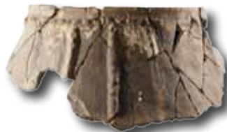
Cerámica del Bronce, San Adrian.

El paso de San Adrian Lizarrate es un yacimiento en cueva que alberga materiales arqueológicos que van desde el paleolítico superior hasta el siglo XX. Útiles de sílex, cerámicas, restos óseos humanos y de fauna, monedas y fragmentos de armas, así como antiguas construcciones afloran en esta cueva situada en las profundidades de Gipuzkoa, a más de 1000 metros de altura.