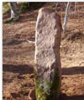
Miliario Romano del Pirineo

Excavación arqueológica que tiene por objeto la delimitación y definición de las estructuras constructivas del principal asentamiento urbano ubicado en la calzada romana ITER31 por el Pirineo (Roncesvalles-Valcarlos). La excavación está dirigida por expertos del Museum of London Archaeology (MOLA) y está destinada al aprendizaje de los Sistemas de Registro Arqueológico utilizados por la institución.