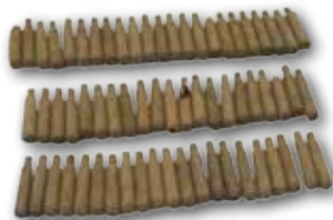
Casquillos de bala, sistema defensivo Sasetta

A raíz de la sublevación franquista de 1936 en los montes de esta zona del valle del Oría se materializó la primera resistencia organizada a través de trincheras y elementos defensivos impulsados desde la comandancia de Azpeitia. En estos lugares se produjeron los primeros enfrentamientos de carácter bélico, que frenaron por primera vez a los sublevados en el País Vasco. Dentro de las labores de recuperación de la memoria histórica se está documentando este patrimonio olvidado.