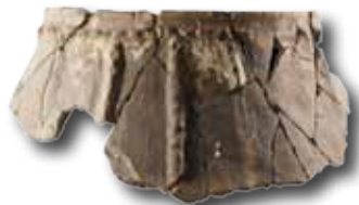
Cerámica del Bronce, San Adrian.

El paso de San Adrian Lizarrate es un yacimiento en cueva que alberga materiales arqueológicos que van desde el paleolítico superior hasta el siglo XX. Útiles de sílex, cerámicas, restos óseos humanos y de fauna, monedas y fragmentos de armas, así como antiguas construcciones afloran en esta cueva situada en las profundidades de Gipuzkoa, a más de 1000 metros de altura.