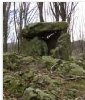
Aitzetako Txabala, Txoritokieta

Colaboran: Ayuntamiento de Erreenteria, Diputación Foral de Gipuzkoa.