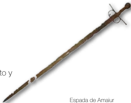
Espada de Amaiur

Colaboran: Amaiurko Herrie, Ayuntamiento de Baztan.