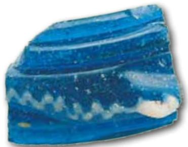
Fragmento de brazalete, Basagain

Colaboran: Ayuntamiento Anoeta, Diputación Foral de Gipuzkoa.