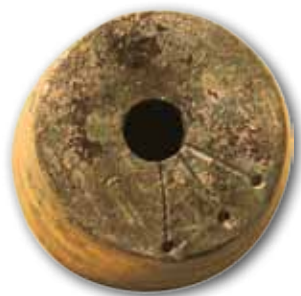
Pesa de bronce, Munoaundi

Las excavaciones en el poblado de Munoaundi se centran en analizar el modo de vida de sus habitantes durante la Edad del Hierro y su sistema defensivo (muralla y sistema de acceso al recinto). Actualmente, la investigación se centra en dos áreas en las que se estudian el acceso al recinto y el área de habitación junto a la muralla.