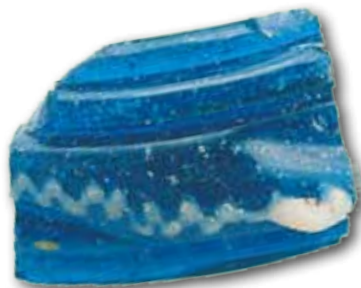
Fragmento de brazalete, Basagain

Colaboran: Ayuntamiento Anoeta, Diputación Foral de Gipuzkoa.