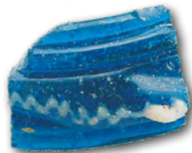
Eskuko baten zatia, Basagain

Laguntzaileak : Anoetako Udala, Gipuzkoako Foru Aldundia