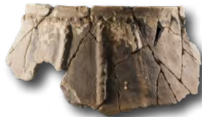
Brontze aroko zeramika, San Adrian.

Laguntzaileak: Gipuzkoa eta Arabako Partzuergo Orokorra, Zegamako, Segurako, Idiazabalgo, Asparrenako, Donemiliagako eta Zeraingo udalak, Gipuzkoako Foru Aldundia, Aizkorri Parkea.