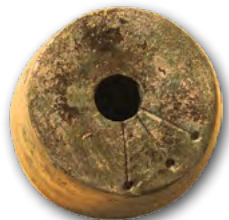
Brontzeko pisua, Munoaundi

Munoaundi Bigarren Burdin Aroko herri harresitua da. Bertan daramagun ikerketa-proiektua ildo nagusiago baten barruan txertatzen da eta bideratuta dago Gipuzkoako Burdin Aroa hobeto ezagutzera. Aztarnategian bertan, orain arte egin ditugun lanek bi helburu nagusi dituzte, batetik, bertako biztanleek Burdina Aroan izandako bizimoduetan sakondu, eta bestetik, herri harresituaren defentsa-sistema hobeto ezagutu.