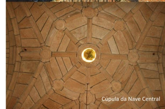
Cúpula da Nave Central