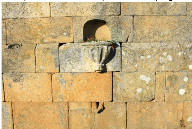
Exterior da sancristía sur con depósito para o lavamanos interior. Orixinal e belo traballo de cantería exterior e interior.

Ademais da porta principal, no lado sur ábrese outra porta enmarcada en orelleiras existindo outra porta no lado norte que non se emprega.