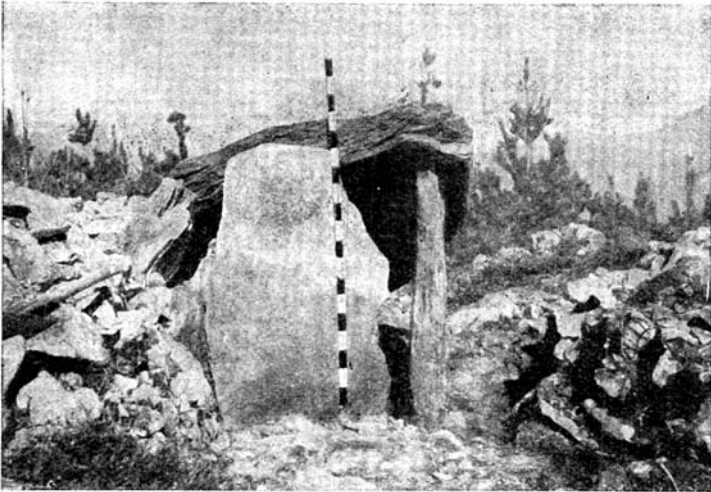
Dolmen de Sagastieta-ko lepua , de la estación dolménica de Igoín-Akola descubierto y explorado por miembros de la Sección de Prehistoria del Grupo «Aranzadi», que han elevado a ocho (seis indubitables y dos inseguros) el número de dólmenes de la estación hasta ahora impropriadamente llamada de Landarbaso.

la acción investigadora de los tres prehistoriadores citados pudo extenderse a monumentos situados en Navarra, Vizcaya y Alava.