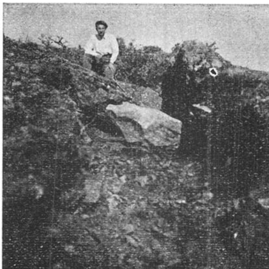
Fof. 3, Dolmen de Diruzulo después de excavado.

En el collado de este nombre, situado al NE. del pico de Kalamua , existe un montículo de piedras, cuyo diámetro y altura miden 7 metros y 0,60 respectivamente. En el centro tiene un