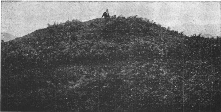
Fot. 2. Dolmen de Diruzulo .

En el centro de la cámara (X, fig. 2) hay un hoyo artificial hecho en la roca natural (ofita) del subsuelo que mide 1,10 de largo, 1,10 de ancho y 0,50 de alto. Este hoyo asimila el dolmen de Diruzulo a algunos de la sierra de Elosua-Plazentzia (Aranzadi, Barandiarán y Eguren: Exploración de diez y seis dólmenes de la sierra de Elosua-Plazentzia. San Sebastián, 1922).