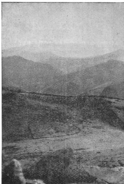
Foto n.º 2.-Supuesto resto prehistórico.

nicipales. Pero si así fuera y tratándose de una laja, que no lleva marca de ninguna clase, al menos apreciablemente, cabría la presunción lógica de considerar que habría sido dispuesta en el terreno de tal forma que facilitara la dirección de la muga, y por consecuencia, la referencia al siguiente mojón de la muga. En cambio su disposición no concuerda en absoluto con la dirección de la línea de muga, la cual parece estar constituida por una serie de estacas unidas con alambre que pasa cercanamente y que puede apreciarse en la fotografía núm. 1.