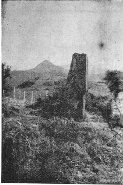
Foto n.º 1.-Supuesto menhir.

Supuesto resto prehistórico. — La fotografía núm. 2 que ha sido tomada desde un punto algo más elevado que el de situación del menhir, ya sobre la cresta del monte Honyi, nos muestra el collado a que nos hemos referido.