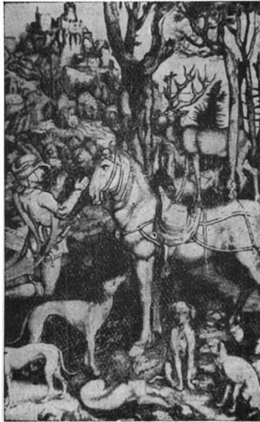
San Huberto, patrón de los cazadores.

que antes campaban a sus anchas. Así tenemos: "Barranco de las Corzas", en tierras treviñesas cercanas a Faido; "Campo de las Corzas", en las estribaciones de la Sierra de Cantabria; "Fuente del Corzo", en la Sierra de Encia; "Pieza del Lobo", en Lagrán; "Portillo del Lobo", en los montes de Vitoria; "Cueva del Lobo" y "Ventana del Lobo" (otros dicen "del Raposo"), en Apellániz; "Paso de los Lobos" y "Loma de las Raposeras", en Bujanda; "Raposera", en Lagrán y Marquinez; "Cueva del Raposo", en Santa Cruz de Campezo; "Peña del Raposo", en Alda; "Ajariiturri"