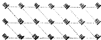
- 2 -

Parece ser que con esta nueva disposición de los colgadores se consigue evitar lo que tanto se ha discutido: que se vean los pájaros unos a otros.