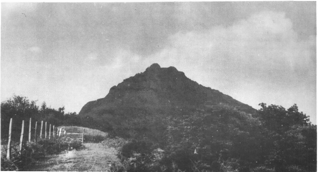
4.—Situado en Navarra, junto al límite con Guipúzcoa, el monte Kopakarri constituye un lugar ideal para la observación de Rapaces y Córvidas.