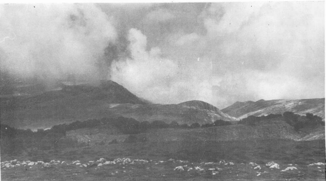
6.—Monte Pardarri, Aralar, visto desde Aparain.