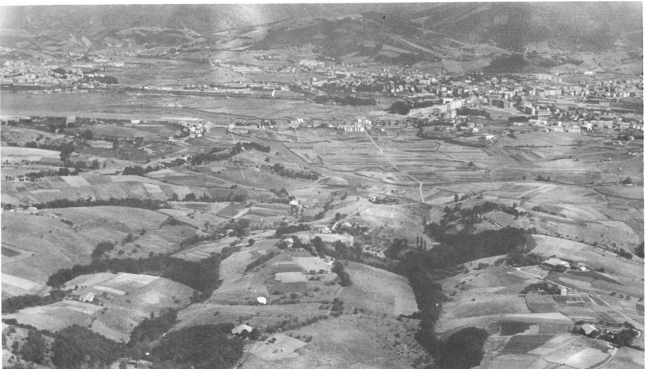
8.—Señorío de Urdanibia (Fuenterrabía), atravesado por la regata de Jaizubía y canal de Amute. Al fondo la ciudad de Irún.