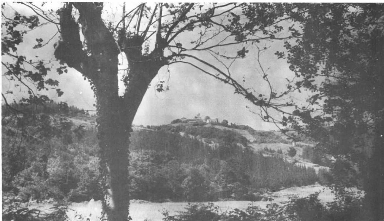
9.— San Miguel de Artadi (Zumaya), un verdadero paraíso de los pájaros, cruzado en Primavera y Otoño por las corrientes de migrantes.