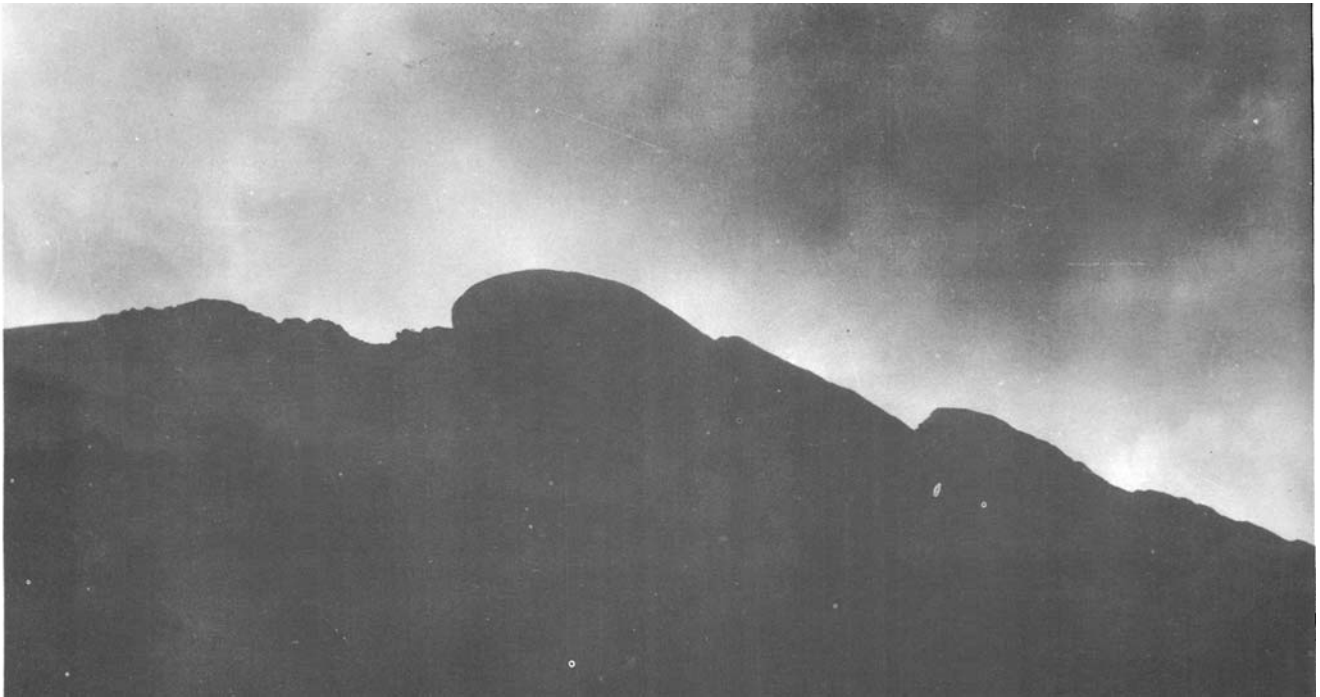
7.—Las Peñas de Aya, uno de los últimos reductos en Guipúzcoa del Buitre común.