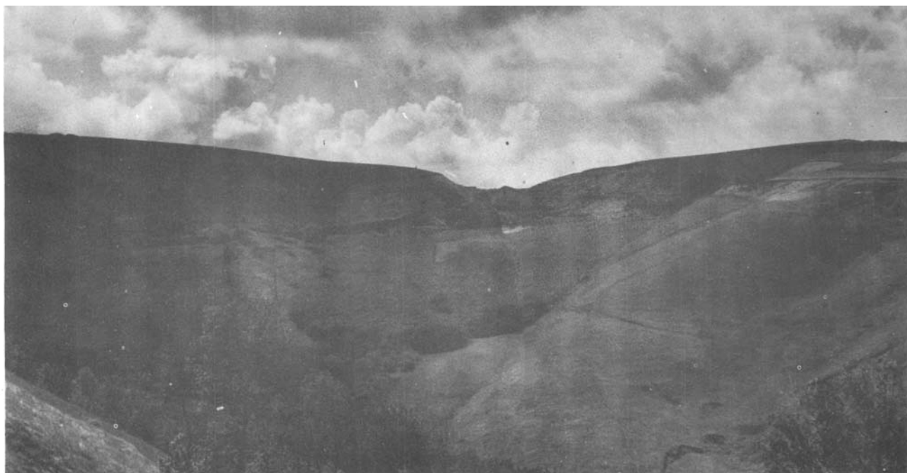
10.—«Pikote», en la costa entre Deva y Zumaya, un extraordinario lugar de paso y observación de aves.