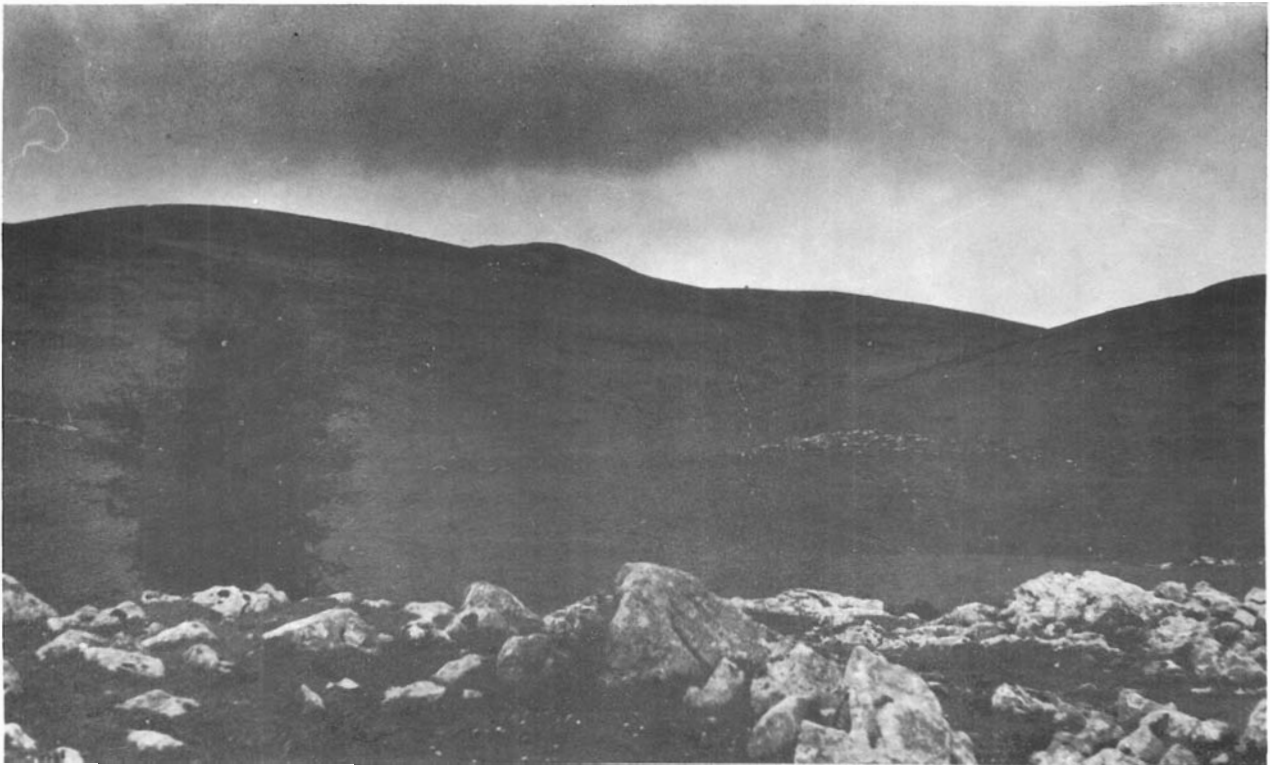
5.—Campa de Igaratza, Aralar.