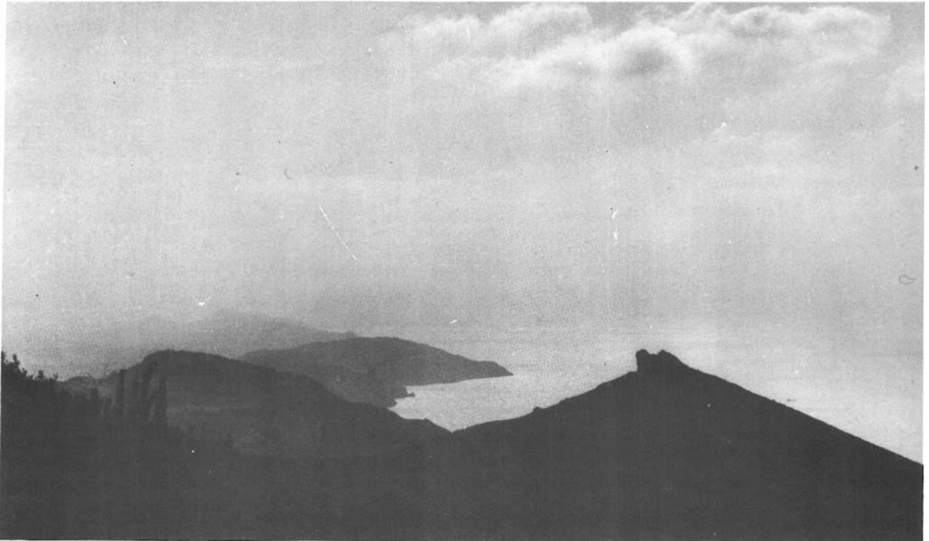
1.—La costa guipuzcoana vista desde el monte Jaizkibel