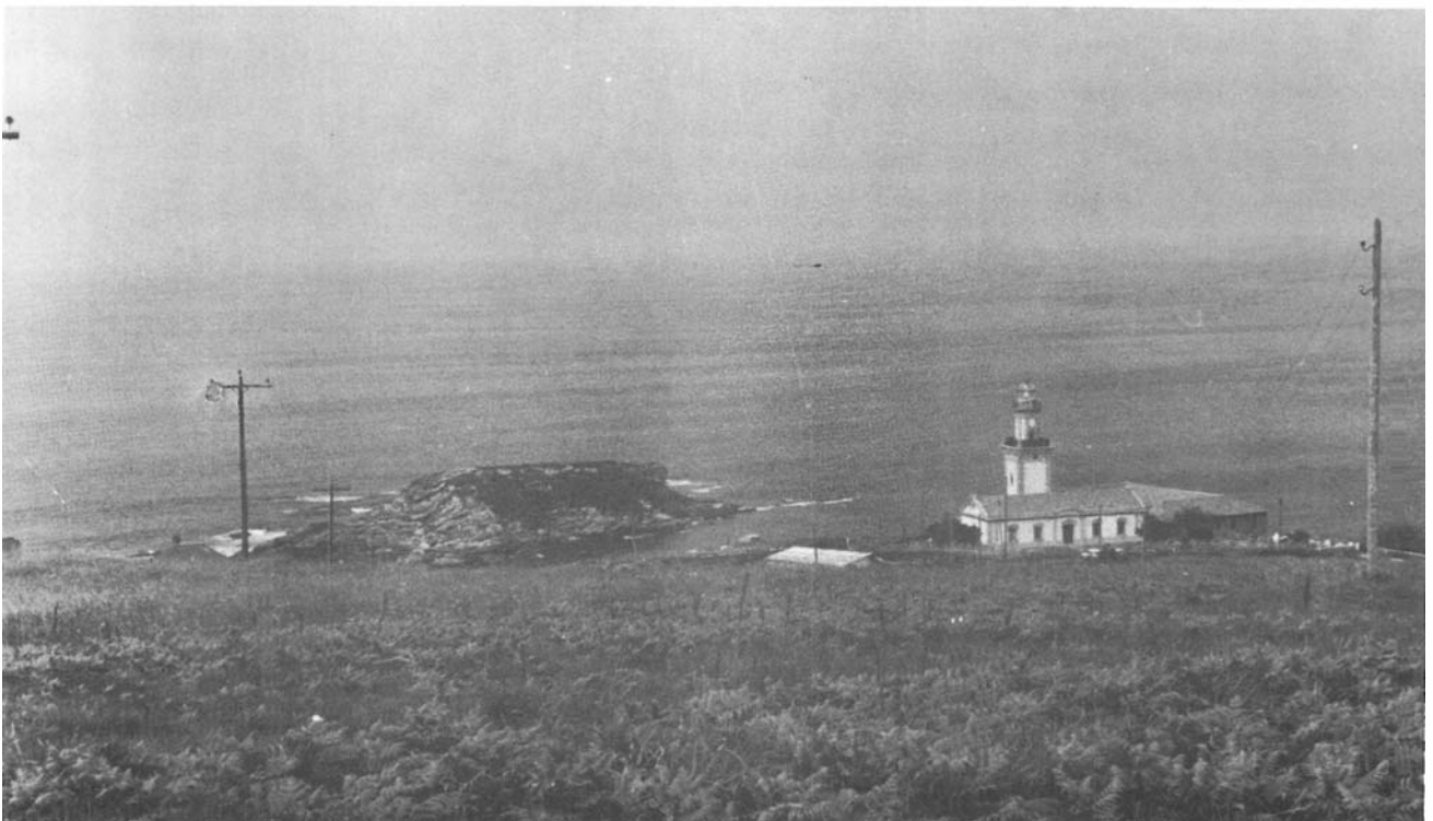
2.—Cabo Higuer, donde son muy notorios los pasos primaveral y otoñal, especialmente de fringílidos y aves marinas.