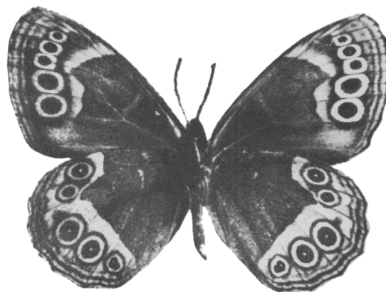
2: Cara ventral.