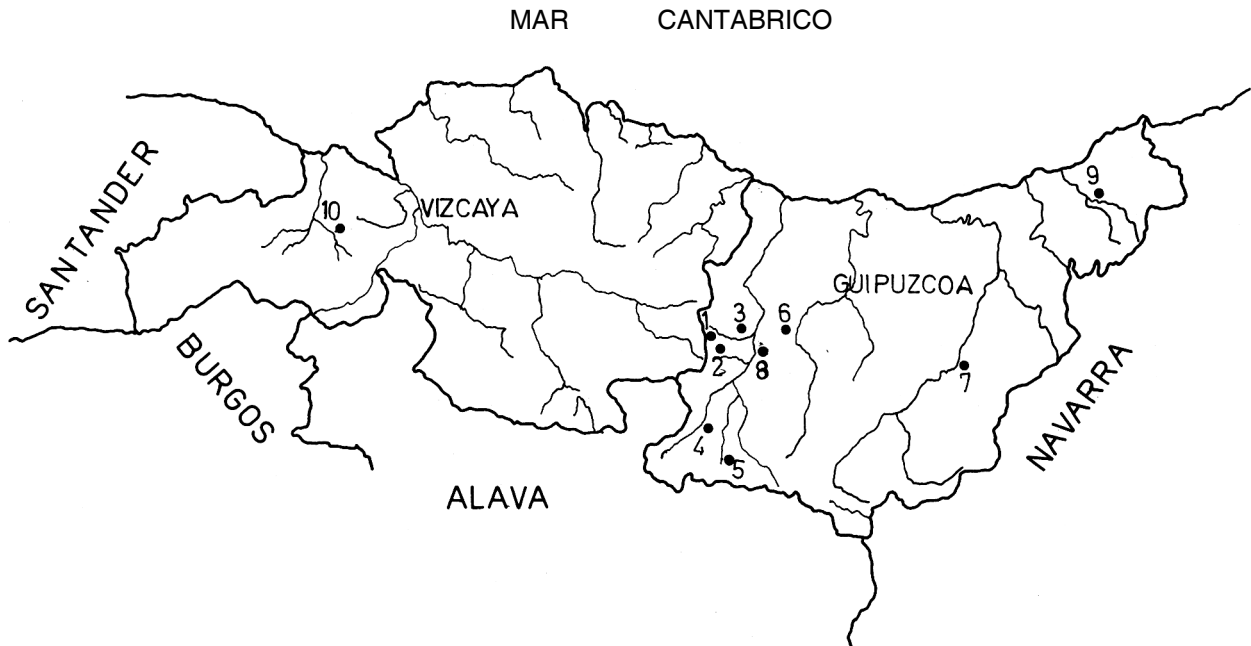
Fig. 1.—Localización de los hallazgos de Micromys minutus en el País Vasco. 1, Elgueta. 2, Anguiozar. 3, Ubera. 4, Arenaza. 5, Araoz. 6, Elosua. 7, Alzo-Azpi. 8, Vergara. 9, Oyarzun. 10, Galdames.

En cuanto al biotopo, el común denominador de todas estas localidades son las praderas con abundantes gramíneas, que consideramos el lugar idóneo para el asentamiento y reproducción del Micromys minutus . También son comunes a todas las localidades los cultivos de maíz, nabo y patata. El arbolado, por el contrario, varía de una localidad a otra.