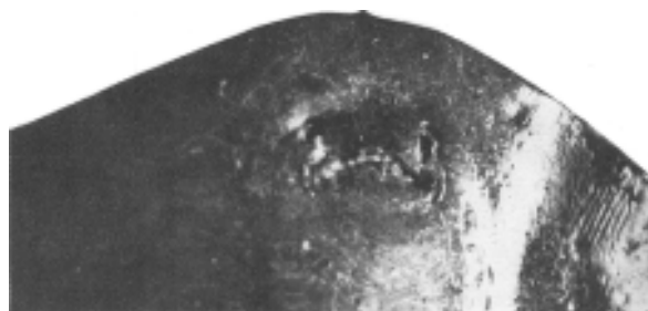
2b Detalle del rostro en vista ventral

junto con especies pelágicas; en algunos casos se trata de especies migradoras estenotermas como Tetragonurus cuvieri (Risso), (Ibáñez, 1975), pero de todas formas resulta extraño ver un animal cuya morfología está perfectamente adaptada a una vida bentónica sedentaria y que es capaz de comportarse y realizar migraciones tanto longitudinales como ascensionales durante la noche, como una especie pelágica.