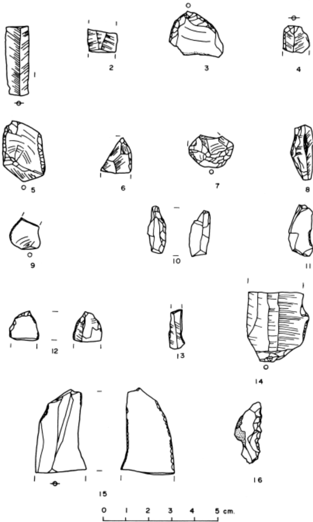
Irud. 7.1. Harri-industria (ukipendun printza eta ijelkiak).