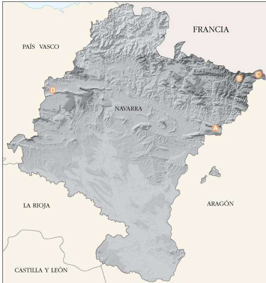
Figure 1.- Study area and localization of citril finch ( Serinus citrinella ) sampling sites: Bigüézal (A), Uztárroz (B), Isaba (C), Otsaportillo (D).

Uztárroz, P. sylvestris ; Isaba, P. uncinata ). Contrariamente, el punto de muestreo en Otsaportillo se situó en el margen de un hayedo, al borde de espacios abiertos formados por praderas.