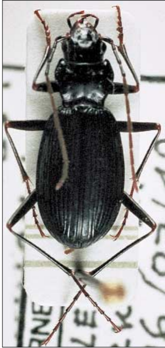
2. Irudia.- Itxina mendiguneko Nebria lafresnayeri . Figure 2.- Nebria lafresnayeri from Itxina.