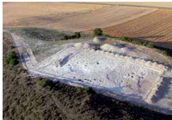
Fig. 1. Ejemplo de "yacimiento sin estratigrafía". Ocupación altomedieval de Zornoztegi (Salavtierra Agurain, Alava).

En este caso, cada depósito secundario de relleno de estas unidades negativas ha de ser estudiado como un contexto único y raramente se presta a ser datado cruzando los datos de las secuencias estratigráficas y las fechas radiométricas. Por otro lado, es muy relevante entender que los depósitos que excavamos son de amortización y que este es el caso de los destinados preferentemente al almacenaje de cereales y leguminosas a largo plazo, puede haber una diferencia cronológica muy relevante entre el momento de su realización y de su abandono. En cambio, los agu-