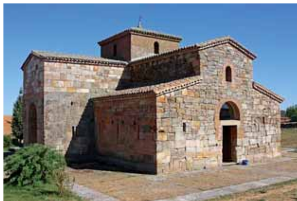
Fig. 2. Iglesia altomedieval de San Pedro de la Nave (Zamora).

teñas se pudo verificar mediante el empleo cruzado de dataciones radiométricas y dendrocronológicas que la viga(s) había sido reutilizada de una construcción romana. Y lo mismo se pudo observar en el caso de San Juan de Baños (Palencia), donde se dató una segunda viga. En cambio, las grapas, realizadas probablemente en el momento de la realización del edificio, fueron datadas en la segunda mitad del siglo VII (Rubinos 1999; Alonso et alii 2004).