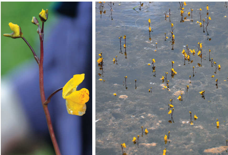
Fig. 1.- A) Tallo florífero de U. australis . B) La nueva población de U. australis en floración (21.07.2011) Fig. 1.- A) Floral stem of U. australis . B) The new population of U. australis blooming (21.07.2011)