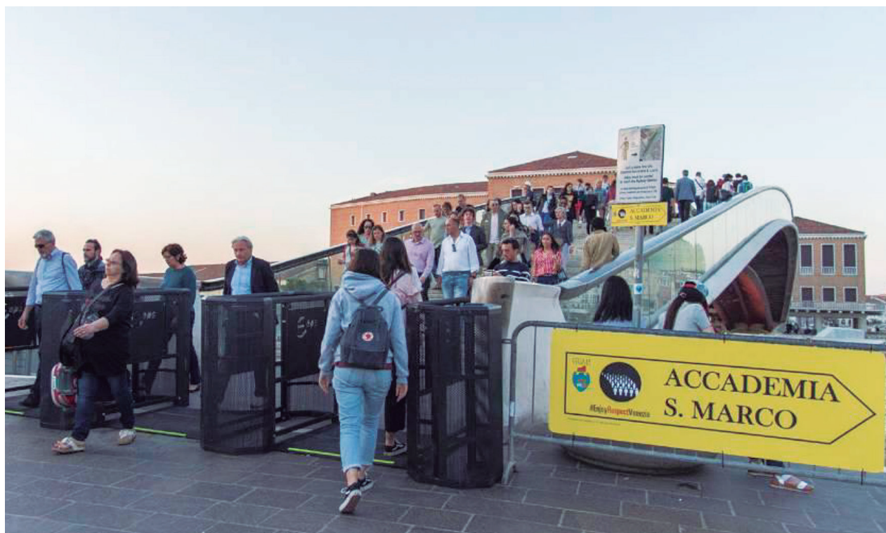
Fig.6. Tornos en Venecia, motivo de polémicas y protestas por lo que representan de tematización de la Perla del Adriático. / Turnstiles in Venice are a source of controversy and protests because they transform the "Pearl of the Adriatic" into a sort of theme park.

Nuestros centros monumentales no están preparados para soportar tantos miles de turistas, que en el deseo legítimo de disfrutarlos acaban sin embargo conculcando su naturaleza, poniendo en riesgo un paisaje patrimonial frágil y no renovable, muy afectado ya por las intervenciones en él para ser expuesto, y extremadamente vulnerable a la acción de los viajeros por lo que ello implica de sobreexplotación y de mixtificación. Sirva recordar al efecto eventos multitudinarios en Córdoba, como la fiesta de las Cruces, mercantilizada hasta extremos alarmantes, o la de los patios: desde su reconocimiento como Patrimonio Inmaterial de la Humanidad por la Unesco ha desvirtuado su naturaleza y terminado por derivar en algo distinto tras ser invadida por una muchedumbre ansiosa que ha expulsado de ella a muchos cordobeses (Fig. 7). La masificación tiene efectos publicitarios y económicos inmediatos, pero acaba por provocar el rechazo y la huida de la población residente, la pérdida de valor. De ahí sus riesgos.