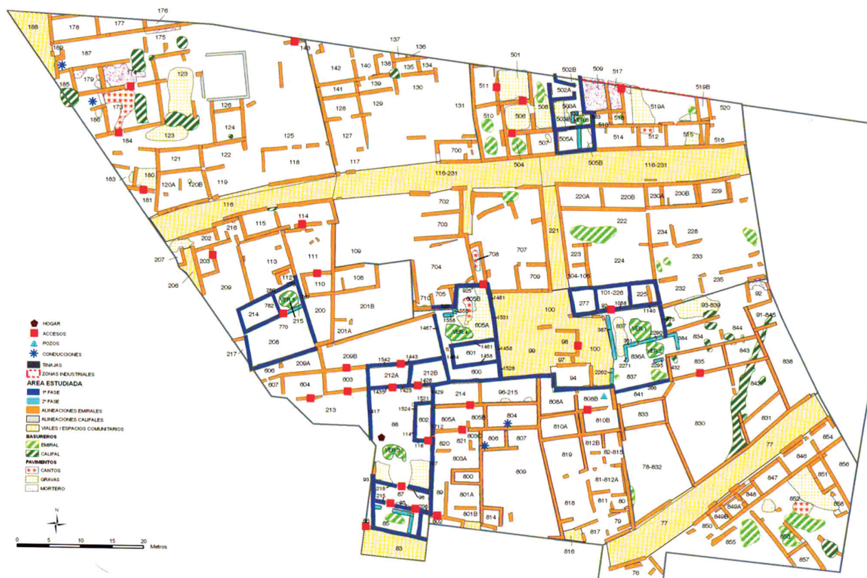
Fig.3. Arrabal de Saqunyah, conformado básicamente por estructuras domésticas, comerciales e industriales. Planta de las excavaciones. / Suburb of Saqunyah which basically comprises domestic, commercial and industrial features. Plan of the excavations.

de varias casas abiertas a un espacio común evoca ya en alguna medida el de la casa de vecinos que siglos más tarde acabaría materializando en Córdoba a través de multitud de variables, capitalizadoras sin duda de influencias muy diversas.