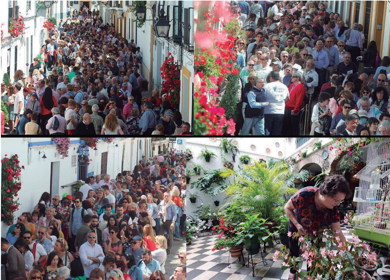
Fig.7. Escenas de masificación durante la fiesta de los patios en Córdoba, que contrastan grandemente con el espíritu de disfrute familiar e íntimo de estos últimos. / Scenes of overcrowding during Córdoba's Patio Festival. This is at odds with the traditional intimate family spirit of the city.