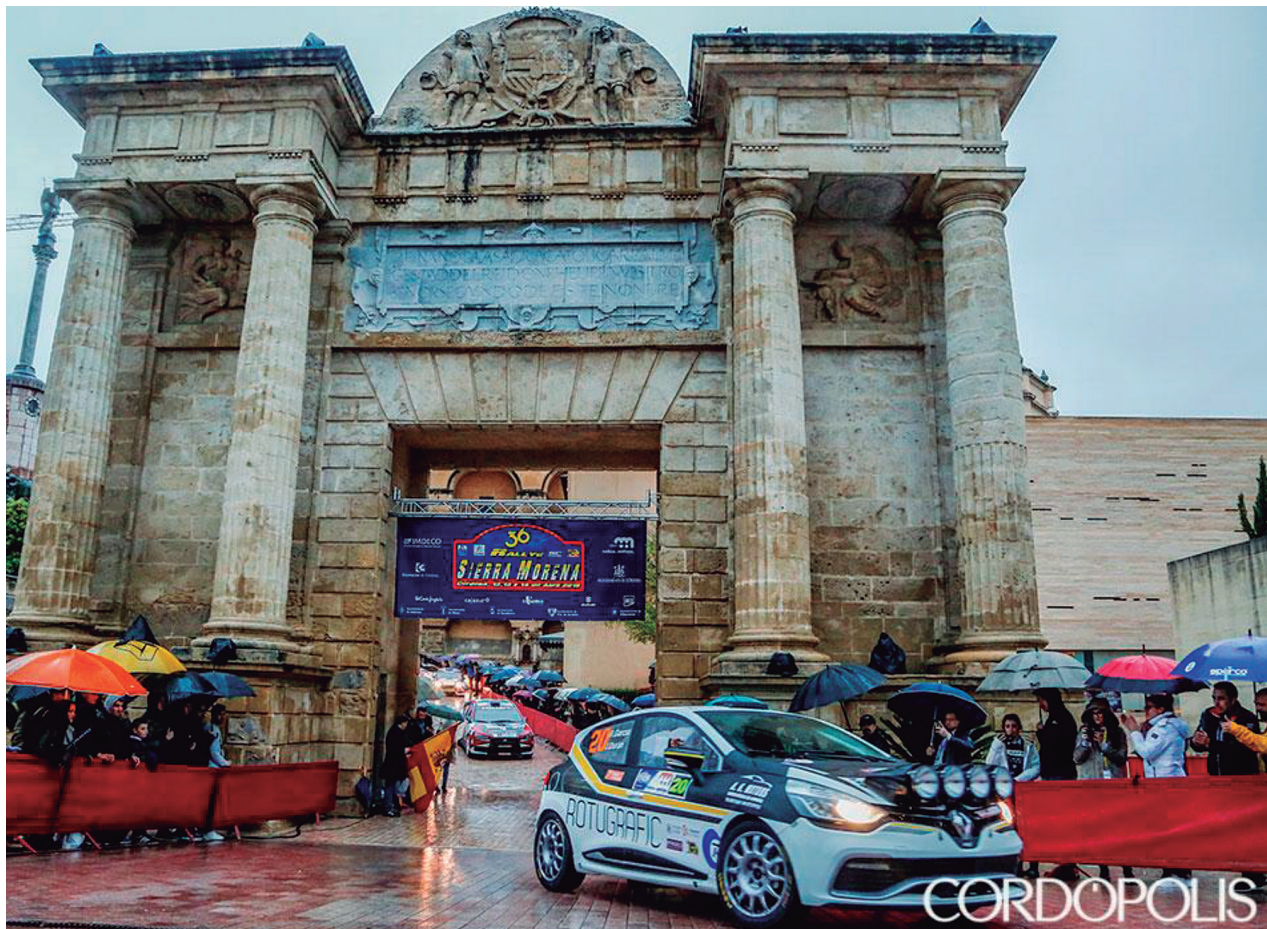
Fig.5. Córdoba. Prueba deportiva celebrada en pleno corazón de su entorno monumental declarado por partida doble Patrimonio de la Humanidad. / Córdoba. Sporting event held in the heart of its monumental district which was twice declared a World Heritage List.

la hostelería se había convertido en su cruz de guía; asistía, impávida, a la desnaturalización y el colapso de su centro histórico; seguía sin disponer de un proyecto conjunto de futuro, incapaz de diseñar actuaciones al margen de los ciclos políticos; permanecía indiferente a la transformación de sus espacios urbanos en beneficio del ruido, las tabernas y un epicureísmo feroz y mal entendido; aplaudía que masas informes invadieran sus calles a riesgo de echar de ellas a quienes las habitan; derrochaba patrimonio en absoluta, irresponsable y temeraria impunidad, confiada en el potencial de la Mezquita y los patios... Sin embargo, la Marca Córdoba no puede ser la duda metódica, ni la eterna displicencia, o la polémica por la polémica, sino la abstracción, la transversalidad, la reivindicación rotunda de su idiosincrasia, la motivación, el consenso. No existen las fórmulas mágicas; sólo el trabajo y el tesón en pro de una idea compartida; porque en último término el patrimonio lo generan, alimentan y singularizan los pueblos, que le dan valor. ¿Existe mejor marca que la coherencia...?