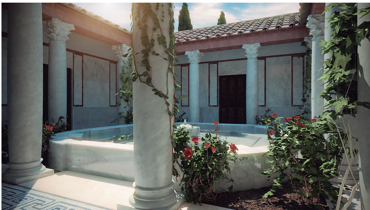
Fig.1. Recreación del peristilo documentado en la denominada "Villa romana de Santa Rosa (Córdoba). / Reconstruction of the peristyle of the Roman "Santa Rosa Villa" (Córdoba).

ciudades del Imperio (Ostia Antica es paradigmática al respecto), convivirían grandes mansiones unifamiliares con bloques de apartamentos y casas de vecinos, en una dualidad con mil pasos intermedios y todo tipo de mixtificaciones que ha llegado incluso a nuestros días.