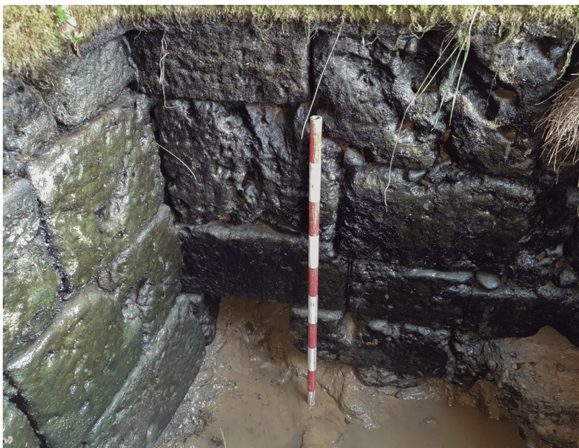
Fig. 5. Vista del interior del depósito después su drenaje. En primer plano se encuentra la entrada del canal de abastecimiento / View of the interior of the tank after its drainage. In the foreground is the entrance to the supply channel.