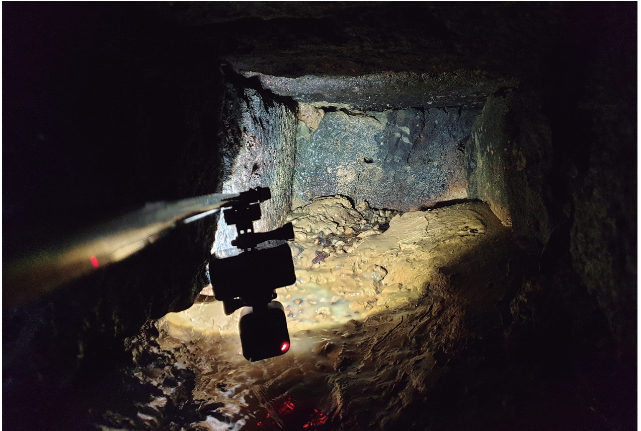
Fig.6. Imagen del interior del canal, al fondo se observa una coloración rojiza producto de las aguas ferruginosas. En la parte baja cuenta con cierta colmatación sedimentaria / Image of the interior of the channel, in the background there is a reddish coloration product of ferruginous waters. In the lower part it has some sedimentary silting.

escasez. La ventaja de almacenar una menor cantidad no solo supone un considerable ahorro en mano de obra y materiales constructivos, sino que también contribuye a evitar posibles contaminaciones y enfermedades asociadas al agua estancada. No obstante, no hay que olvidar que la mayor parte de estas fuentes contaban con abrevaderos asociados a ellas, aunque en la actualidad no sean visibles, con lo que su capacidad acumuladora probablemente sería considerablemente mayor a la actual.