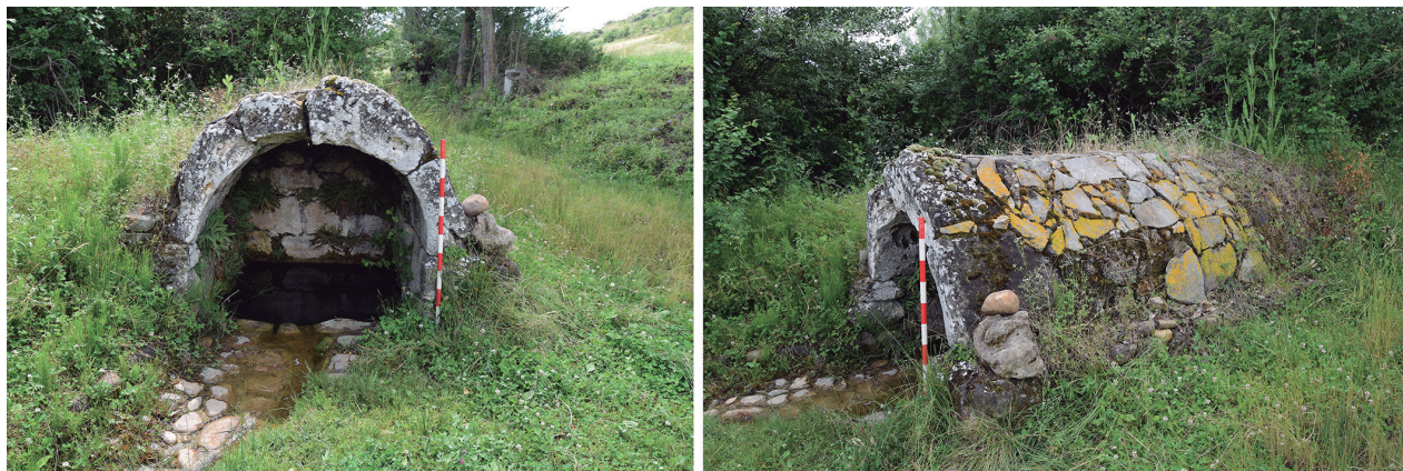
Fig.3. Fuente de Valdealcón, a la izquierda una imagen frontal, a la derecha una vista lateral / Fountain of Valdealcón, on the left a frontal image, on the right a side view.

to han sido menos alterados. Esto supone que la fuente puede ser adscrita a un grupo morfológico específico, concretamente al 2.1. (González-Montes, 2023). A este pertenecen aquellas construcciones diseñadas para contar con una cubierta, erigida sobre el extradós con el fin de protegerlo, que normalmente consta de un tejado a doble vertiente. Esta afirmación se sustenta en la forma de los sillares basales del arco y la hilada que se construye sobre estos, cuyos bloques presentan un característico alargamiento, a todas luces innecesario para recibir únicamente el apoyo del arco, y que por tanto debieron destinar la parte sobrante a acoger la citada cubierta. Esa función puede observarse claramente en aquellas estructuras que aún mantienen su cubierta original, como la fuente de Muro de Ágreda (Soria) o la Fonte do Concelho de Iñanes (Braganza). En otros casos como los de las construcciones leonesas de Prada de la Sierra y Piedras Albas, los tejadillos originales son desmantelados, y posteriormente repuestos por otros de factura más tosca, que no obstante aprovechan los anclajes de los originales. Por último, y al igual que ocurre en Valdealcón, son numerosas las estructuras cuyas cubiertas han sido desmanteladas, pero mantienen dichas piezas basales, pues su desmontaje habría supuesto el desarme del arco. Entre ellas deben destacarse las fuentes de San Pedro de la Viña (Zamora), y la ya mencionada estructura de Valdepolo.