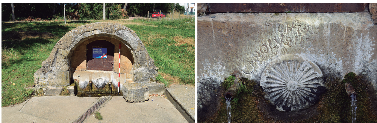
Fig.2. Fuente de Valdealiso: a la derecha detalle de su epigrafía / Fountain of Valdealiso, on the right detail of its epigraphy.

Pese a esta deficiente conservación de su cubierta, tanto las hiladas basales de la cámara como su depósi-