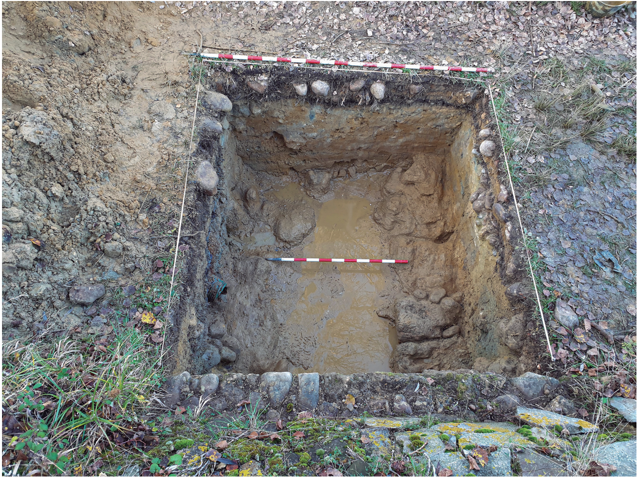
Fig. 4. Imagen cenital de la intervención arqueológica. En la esquina inferior derecha se localiza la atarjea de abastecimiento / Zenithal image of the archaeological intervention. In the lower right corner is located the water supply.