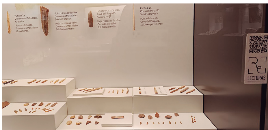
Fig.2. QR del proyecto Relecturas en la sala permanente de Sociedades Prehistóricas. Museu de Prehistòria de València. / QR of the Relecturas project in the permanent exhibition of Prehistoric Societies. Prehistoric Museum of València

Otro proyecto impulsado desde la Universidad de Valencia y desarrollado por 18 museos de la ciudad y el área metropolitana es “Relecturas. Itinerarios museales en clave de género” que nace en 2018. Este proyecto está pensado como un diálogo continuo entre el museo y su entorno, ofrece miradas diversas dirigidas a las colecciones que albergan cada uno de los museos y colecciones museográficas participantes, con la intención de generar nuevos discursos que permitan al visitante reflexionar acerca del papel de la mujer, de los mitos patriarcales o de la desigualdad social entre hombres y mujeres ( www.relecturas.es ) (Figura 2).