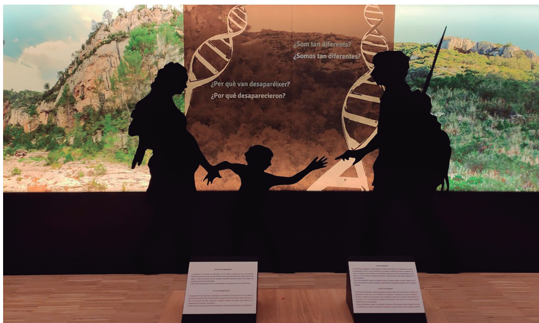
Fig.1. Nueva sala permanente de Sociedades Prehistóricas. Museu de Prehistòria de València. Inaugurada en 2020. / New permanent exhibition of prehistoric societies. Prehistoric Museum of Valencia. Inaugurated in 2020.

Si fijamos la atención en los museos de arqueología y su apuesta por cambiar los discursos, desde el feminismo de la igualdad, la profesora Lourdes Prados los ha clasificado en tres grupos dependiendo del esfuerzo que cada uno de ellos ha hecho por incorporar la perspectiva de género. En un primer grupo estarían aquellos que no han hecho ningún esfuerzo por incorporar debates sobre el género, bien por ideología o por falta de interés. Un segundo grupo estaría formado por aquellos que, no pudiendo modificar significativamente su exposición permanente, son sensibles al tema y desarrollan tanto exposiciones temporales como actividades (Figura 1); el tercer grupo estaría compuesto por museos de nueva creación o renovación en los que existe la voluntad de incorporar la perspectiva de género y que se consigue con más o menos éxito (Prados, 2024).