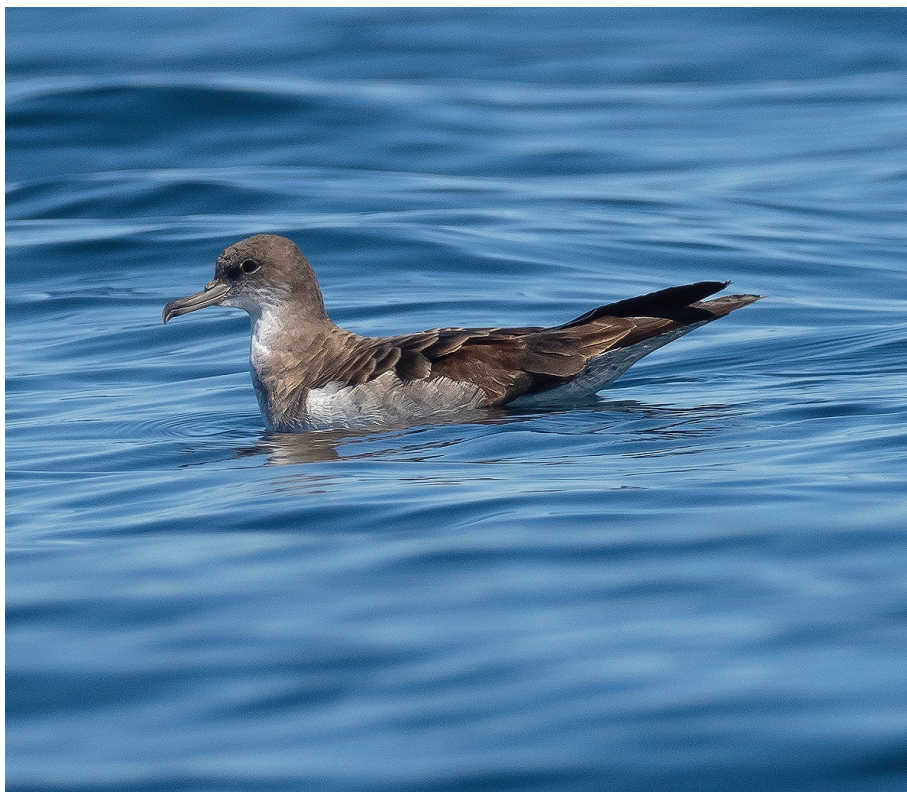
Calonectris edwardsii . Salida pelágica frente a Lekeitio, 15/09/2024. J. Zubiaur.

Higer. 22/03/2022 (R. Cuba, B. Lorenzo) al 30/03/2022. 1 Ad.