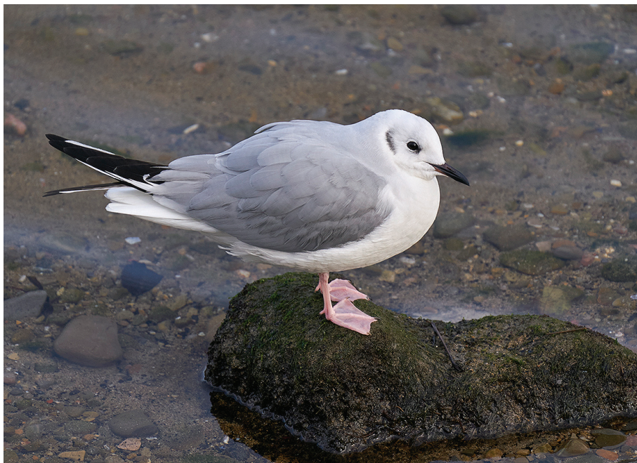
Chroicocephalus philadelphia . Donostia, 14/02/2023. O. Pérez-Amas.

Donostia. 24/12/2024 (X. Saralegi) al 26/01/2025. 1 ex. (1er invierno).