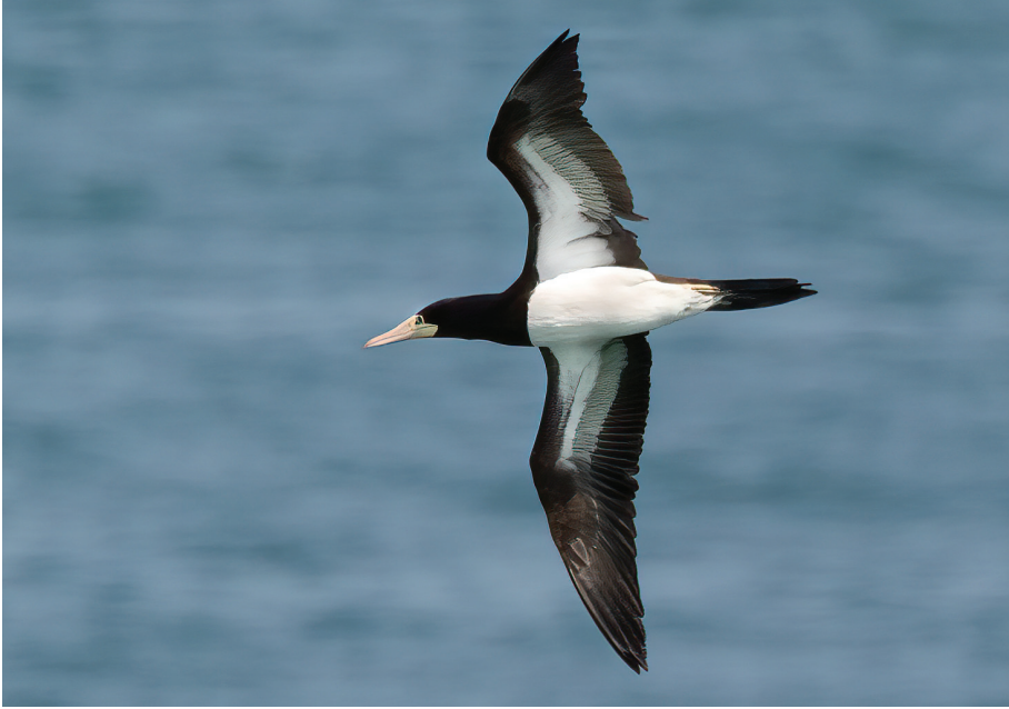
Sula leucogaster . Higuer, 26/03/2022. A. Hernández.

Lekeitio. 16/09/2023 (S. Pagán) al 29/10/2023. 1 ex. (1er año).