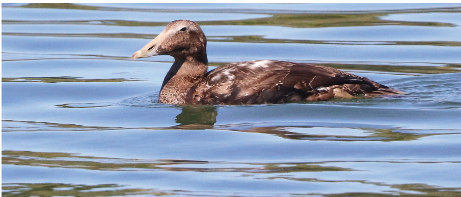
Cita 2024-030. D. Santamaría.

Código 2024-045. Matxixako (BIZ). 08/12/2024 (A. Urrutia, C. de Dios). 1 M. 1er invierno. Fotografía.