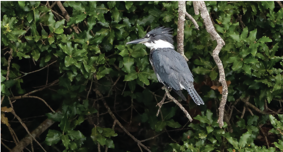
Megasceryle alcyon . Lekeitio, 03/10/2023. J. C. Andrés.

Lekeitio. 16/09/2023 (S. Pagán) al 29/10/2023. 1 ex. (1er año).