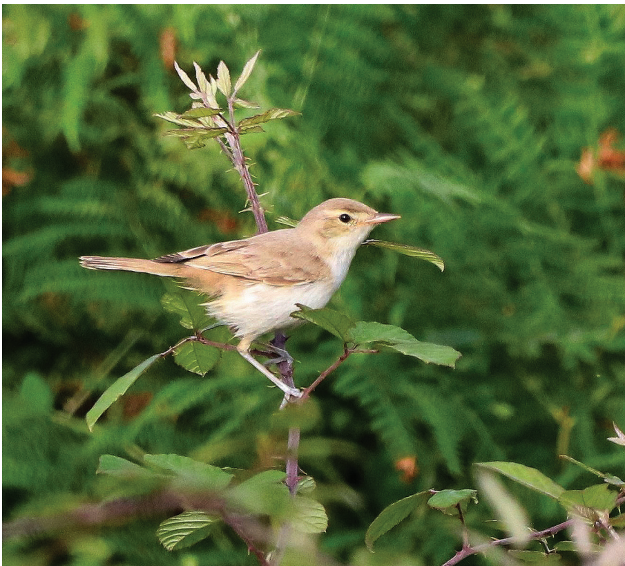
Iduna caligata . Jaizkibel, 10/09/2023. David Santamaría.