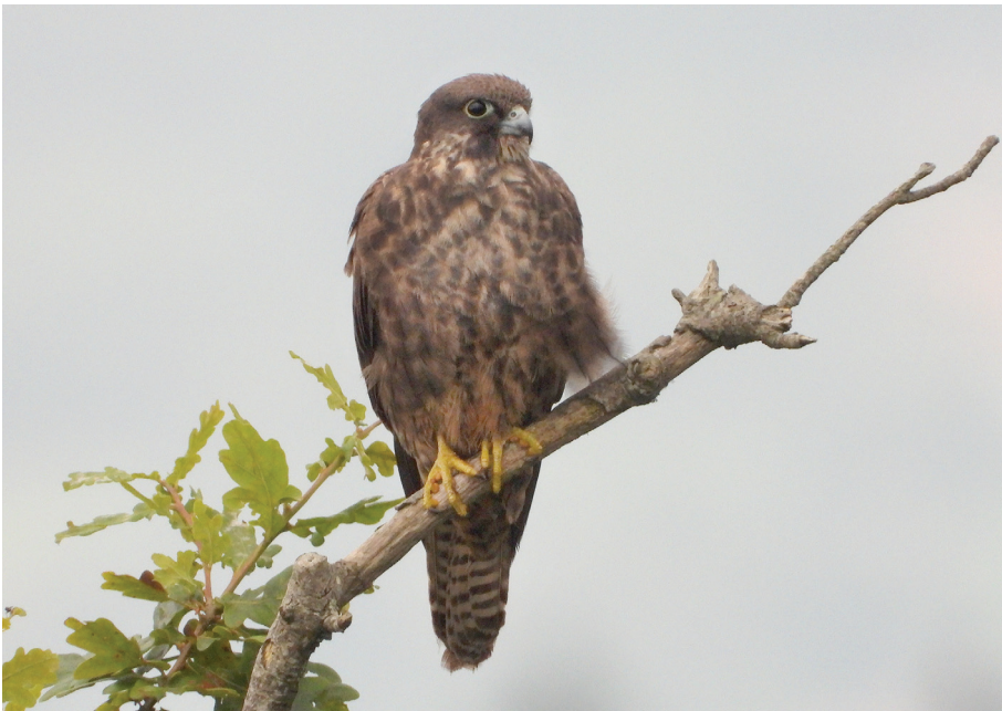
Cita 2024-072. J. Iratzagorria.

Código 2024-073. Alen (BIZ). 19/08/2024 (J. Cañadas) al 20/08/2024 (J. Iratzagorria). 1 ex. Fotografía.