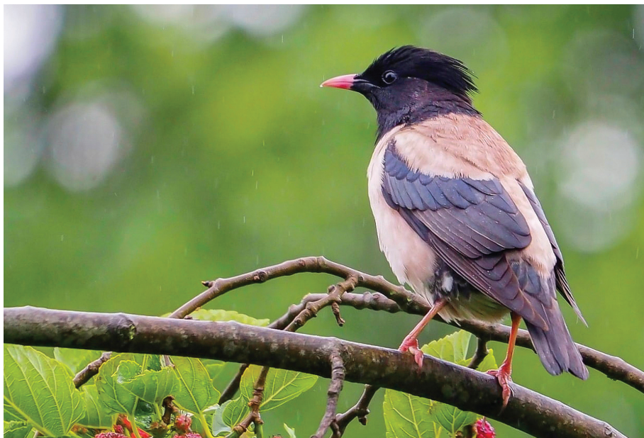
Fotografía: Pastor roseus . Oxinbiribil (Txingudi), 04/06/2021.