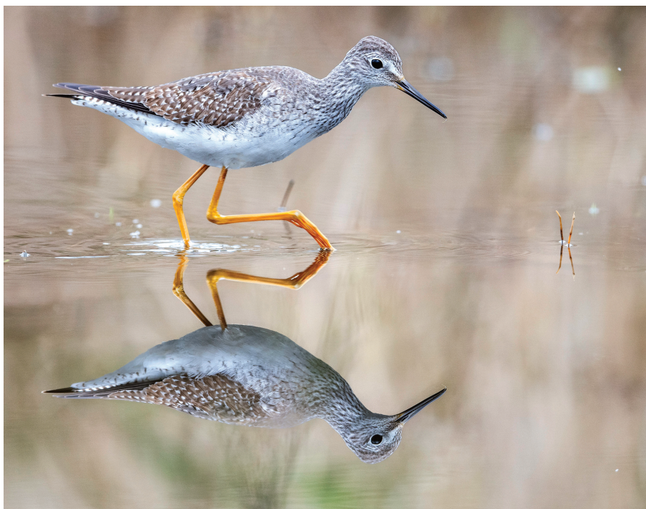
Tringa flavipes . Txingudi, 11/11/2020. F. Calvo.

Salburua. 16/10/2024 (J. Gainzarain) al 17/10/2024. 1 ex. (1er invierno).