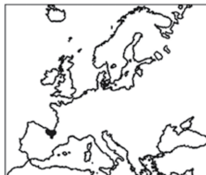
3. ird. Praileaitz I haitzuloaren kokapena. / Situation of Praileaitz I cave.