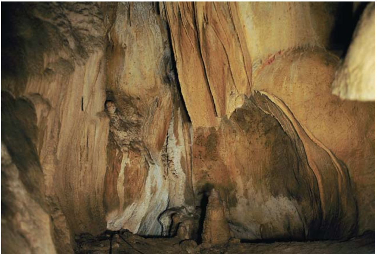
13. ird. Praileaitz I-eko margoen gela. / Paintings room at Praileaitz I.

talagmitikotik gora. Erdian bada zutabe estalagmitiko handi bat 4 m 2 -ko azalera hartzen duena eta ekialderantz, 7 m garapeneko galeria txiki bat, E-IE orientazioa duena.