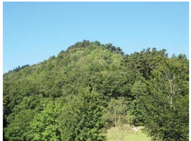
15. ird. Ekain mendia, bertan izen bereko haitzuloa dago. / Mount Ekain, where Ekain cave is located.

Haitzuloa Ekain mendia ekialdeko hegalean zabalitzen da (15. ird.), Goltzibar eta Beliosoro errekek bat egiten duten lekutik metro gutxira –hortik aurrera errekarri Sastarrain deitzen zaio–, Urolako ibarrean, itsas mailatik 90 m gora. Kobazuloa aurkitu zenean, ekialderanzko orientazioa zuela, 2,30 zabal eta 1,20 altu zen, eta 2x3 m-ko atari batetik aldameneko galeria bat ateratzen zen 13 m-ko garapen eta, gutxi gorabehera, 2 m-ko zabalera. Esparru horretatik, non arkeologia-metakina dagoen, hainbat galeria eta gela ateratzen dira, eta leku horietan horma-irudi ugari aurkitu ziren.