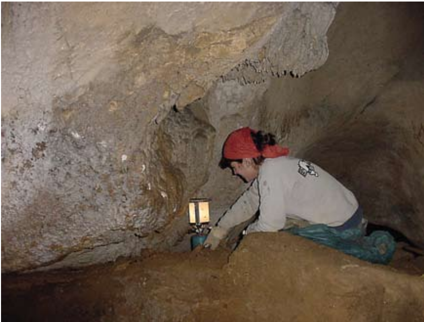
22. ird. Indusketa-lanen ikuspegia hasierako uneetan. / Sight of the excavation at the beginning of the works.

2004ko kanpaina maiatzaren eta uztailaren artean eta irailaren eta azaroaren lehenengo egunen artean izan zen. Atondotik lehen barne-gelara doan pasabidean lan egin zen, baita lehen barne-gela horretan, non beste sutoondo epipaleolito bat agertu zen. Kanpaina luze horretan berrehun itsas maskor baino gehiago aurkitu ziren, pasabidearen maila epipaleolitoan. Halaber, lehen barne-gelan, errenkan hamaika harrizko zintzilikario aurkitu