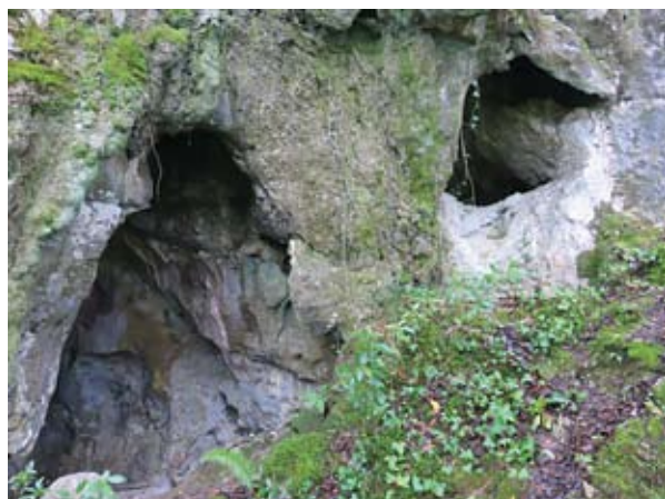
16. ird. Ermittia haitzuloa. / Ermittia cave.