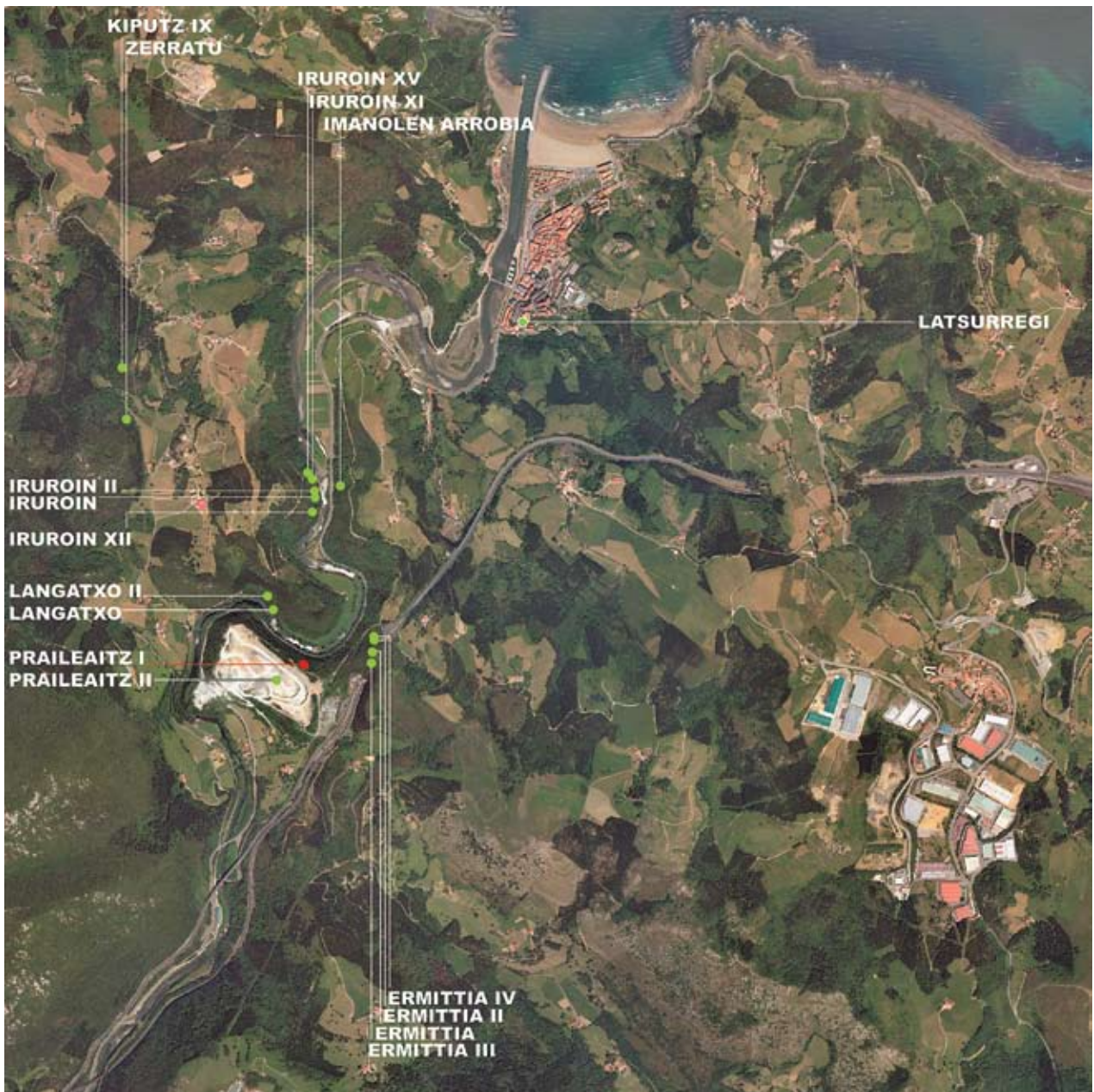
14. ird. Paleolito Aroko aztarnategia duten zenbait haizuloen kokapena Debarrenan (Gipuzkoako Foru Aldundia –1:5000–, T. Carrascal). Location of some caves with Paleolithic sites in Debarrena (Provincial Council of Gipuzkoa –1:5000–, T. Carrascal).

Eremuko lurzoru karetsuak erraztu egiten du haizuloak eta babeslekuak egotea, handiagoak edo txikiagoak, eta horietako asko Historiaurreko hainbat unetan okupatuak, batez ere Paleolito garaian.