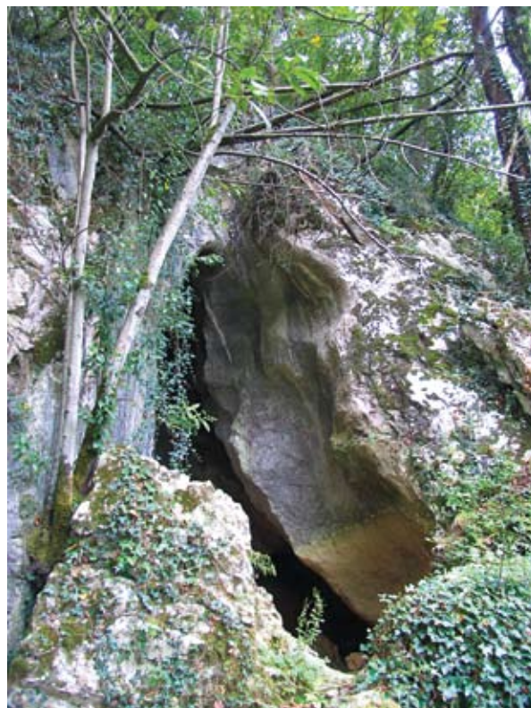
5.-6. ird. Haitzuloaren sarrera aurkikuntzaren unean (1983) (Munibe Taldea) eta indusketa-lanetan zehar. / The entrance to the cave at the moment of the discovery (1983) (Munibe Taldea) and along the excavation works.

Sarrera hori igarota, 34 m 2 -ko atondo bat zabaltzen da (8. ird.), I-H norabidean 7 m eta E-M-an 5 m-ko gehieneko luzera duelarik. Erdiko gunek 10,40 m dauzka, non zulo txiki edo tximinia bat zabaltzen den, eta bertatik sartu da bertan dagoen sedimentuaren zati bat. Ekarpen natural horretaz gain, gune horrek –haitzuloko argitsuena– potentzia estratigrafiko handiena du, han antzeman baitira hainbat okupazio labur Epipaleolitikotik Solutre aldira. Gelaren ekialdean 4 m 2 -ko eremu txiki eta eroso bat zabaltzen da. Gunearen sabaia 0,80 m altu baino ez da, eta atariaren gainontzeko zatitik kareharrizko hiru blokek banantzen dute. Horietako bat dimentsio handikoa eta sabaitik eroria da; beste biak, beren neurria dela-eta, beharbada lekualdatuta daude sektorea egokitzeko edo mugatzeko.