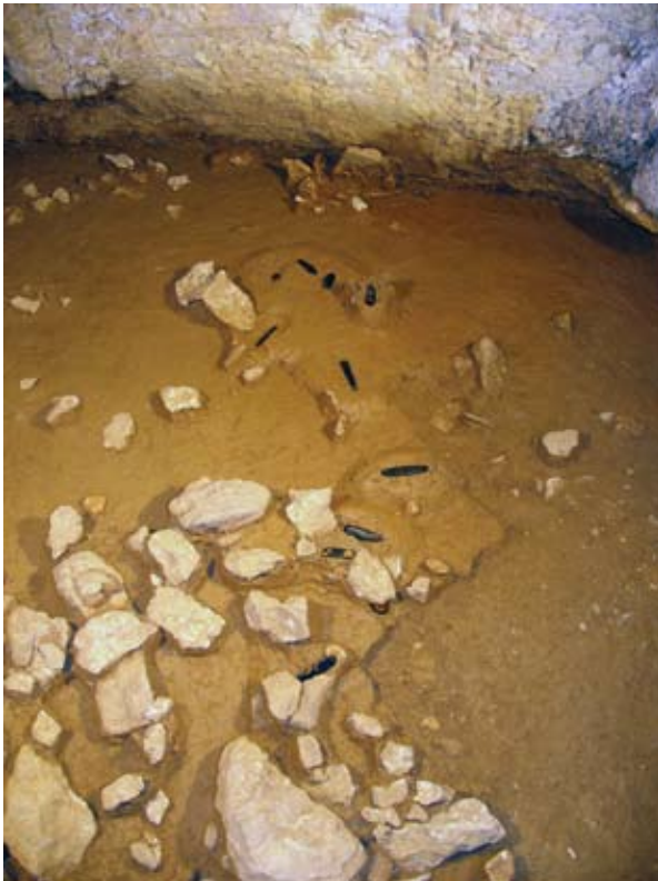
24. ird. Zintzilikarioen multzoa lehen barne-gelan. / Group of pendants at the first inner room.

hamaika zintzilikarioak aurkitu ziren eremuan (24. ird.), hiru gehiago topatu ziren, baita beste hiru ere gela horretako beste leku batzuetan (PEÑALVER, MUJIKA 2007-2008; PEÑALVER, SAN JOSE, MUJIKA, 2006).