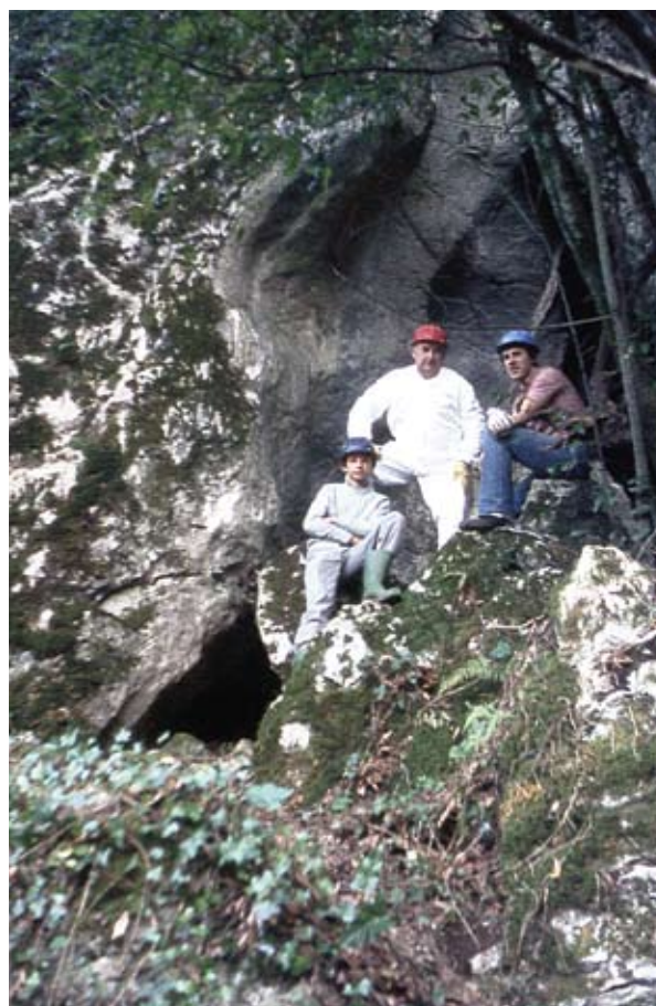
19. ird. Praileaitz I haitzuloaren aurkitzaileak (Munibe Taldea). / Discoverers of Praileaitz I cave (Munibe Taldea).

kobazuloaren kanpotik barrura, sarreraren zati bat estaltzen zuten bloke erorietatik beheko kota batera.