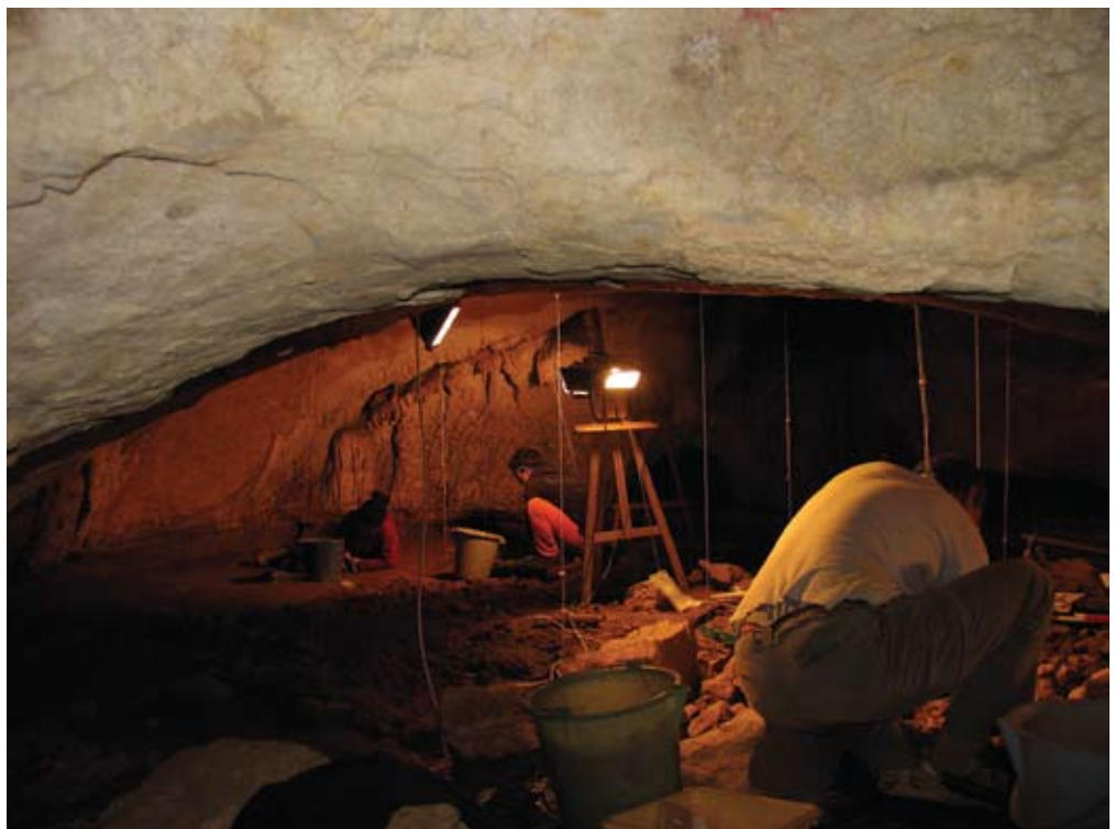
23. ird. Lehen barne-gelaren indusketa-lanak. / Excavation works at the first inner room.

2005eko uztailan bi lekutan egin zen lan: lehen barne-gelaren Madeleine mailan eta atondotik lehen barne-gelara doan pasabidean. Lehen gelan, eta aurreko urtean