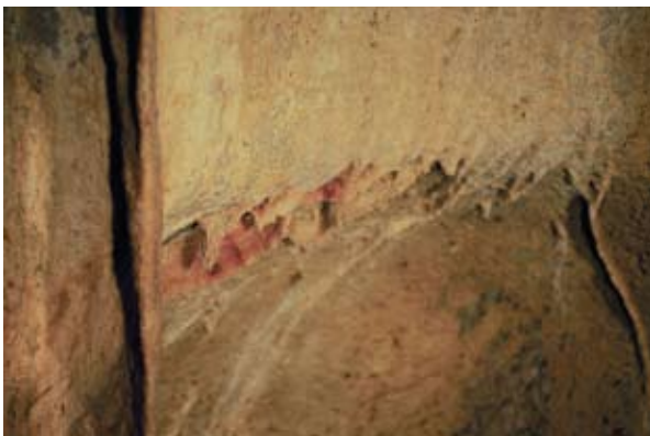
25. ird. Praileaitz I haizuloaren labarretako margo baten xehetasuna. / Detail of one parietal painting at Praileaitz I cave.

2006ko ekainaren eta abuztuaren artean, baita urrian ere, lehen barne-gelan jarraitu zen lanean, eta Solutre mailaraino iritsi zen. Era berean, beste bi lekutan hasi ziren lanak: bigarren barne-gelan, eta ipar-mendebaldetik mendebalderantz doan katazuloan. Kanpaina horretan,