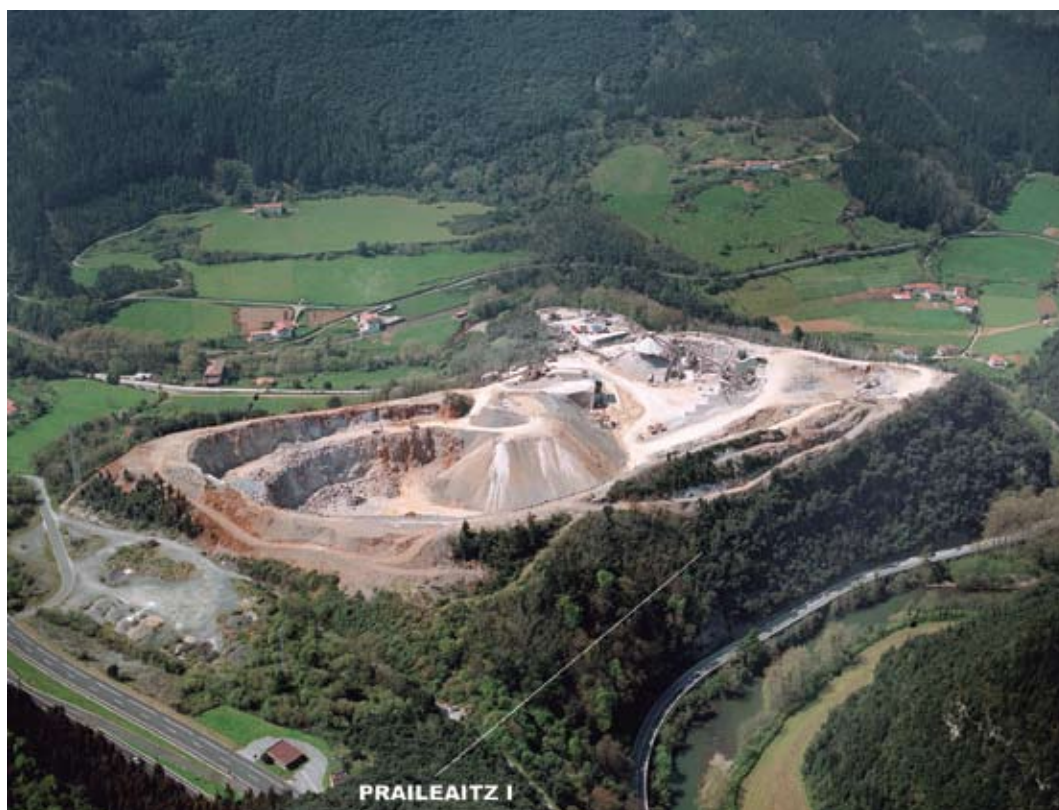
2. ird. Praileaitz mendia gaur egun (PAISAJES). /Mount Praileaitz nowadays (PAISAJES).