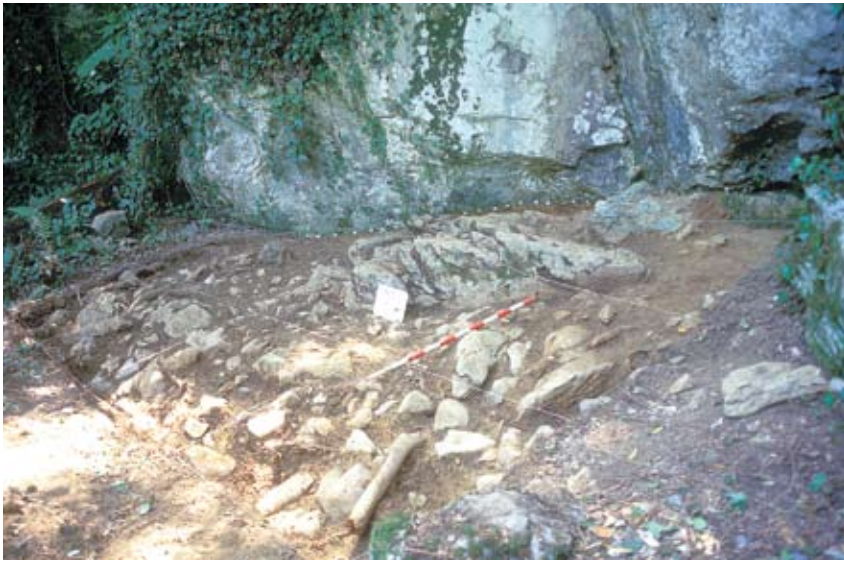
7-9. ird. Praileaitz I-eko landutako eremu ezberdinak. Goitik behera: 7. Kanpoko zonaldea. 8. Atondoaren ekialdeko txokoa. 9. Iparmendebaldeko galeria. / Excavation areas at Praileaitz I. From up to down: 7. Outside area. 8. East corner of the hall. 9. Northwest gallery.