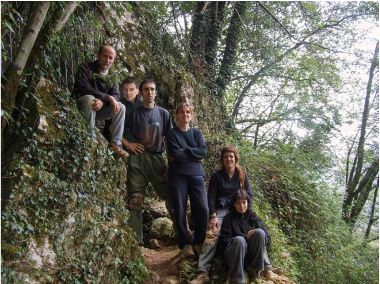
26. ird. Praileaitz I haizuloko ohiko indusketa-taldea. / Usual working group at Praileaitz I cave.