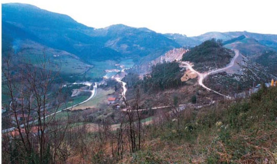
1. ird. Praileaitz mendia 80. hamarkadaren bukaeran (LARRAÑAGA 1991: 63). / Mount Praileaitz at the end of the eighties (LARRAÑAGA 1991: 63).