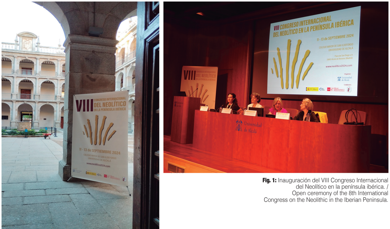
Fig. 1: Inauguración del VIII Congreso Internacional del Neolítico en la península ibérica. / Open ceremony of the 8th International Congress on the Neolithic in the Iberian Peninsula.