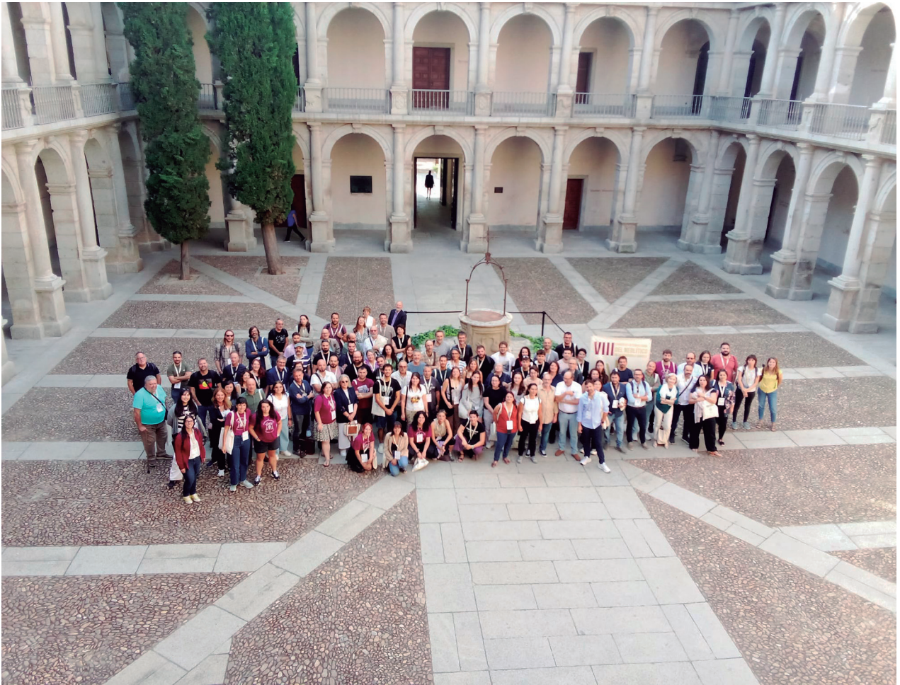
Fig. 2: Asistentes al VIII Congreso Internacional del Neolítico en la península ibérica en el edificio del rectorado de la Universidad de Alcalá, sede del congreso. / Delegates in the 8th International Congress on the Neolithic in the Iberian Peninsula, taken at the Rectorate building of the University of Alcalá, the conference venue.