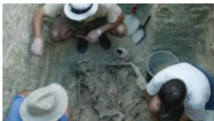
Exhumación de restos en la fosa de Benegiles en julio de 2004, la primera que se realizó en Zamora.

El mapa de fosas de víctimas de la Guerra Civil y el Franquismo que acaba de hacer público el Gobierno central sitúa en Zamora nueve enterramientos (entre más de dos mil en toda España) con restos de 29 cuerpos, todos identificados a excepción de los doce exhumados en 2008 en Faramontanos de Tábara, procedentes de la zona de Valderas, en León.