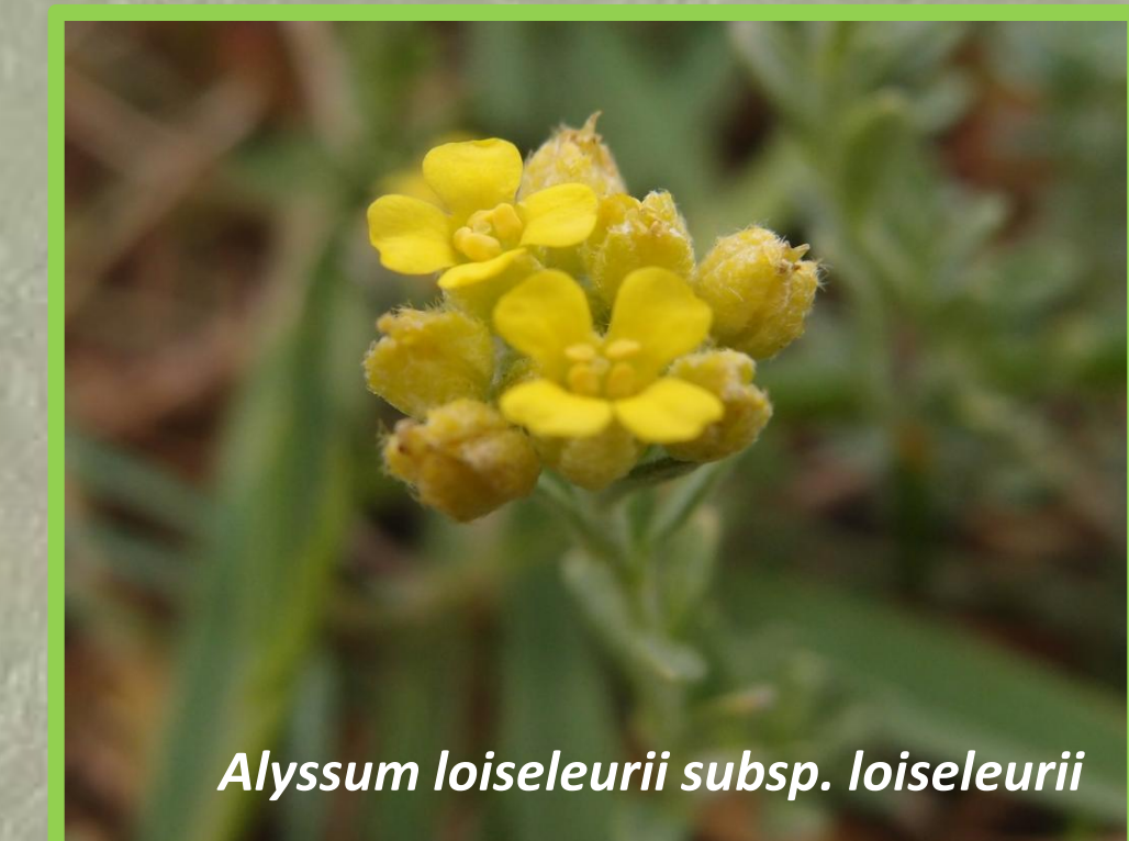
Alyssum loiseleurii subsp. loiseleurii