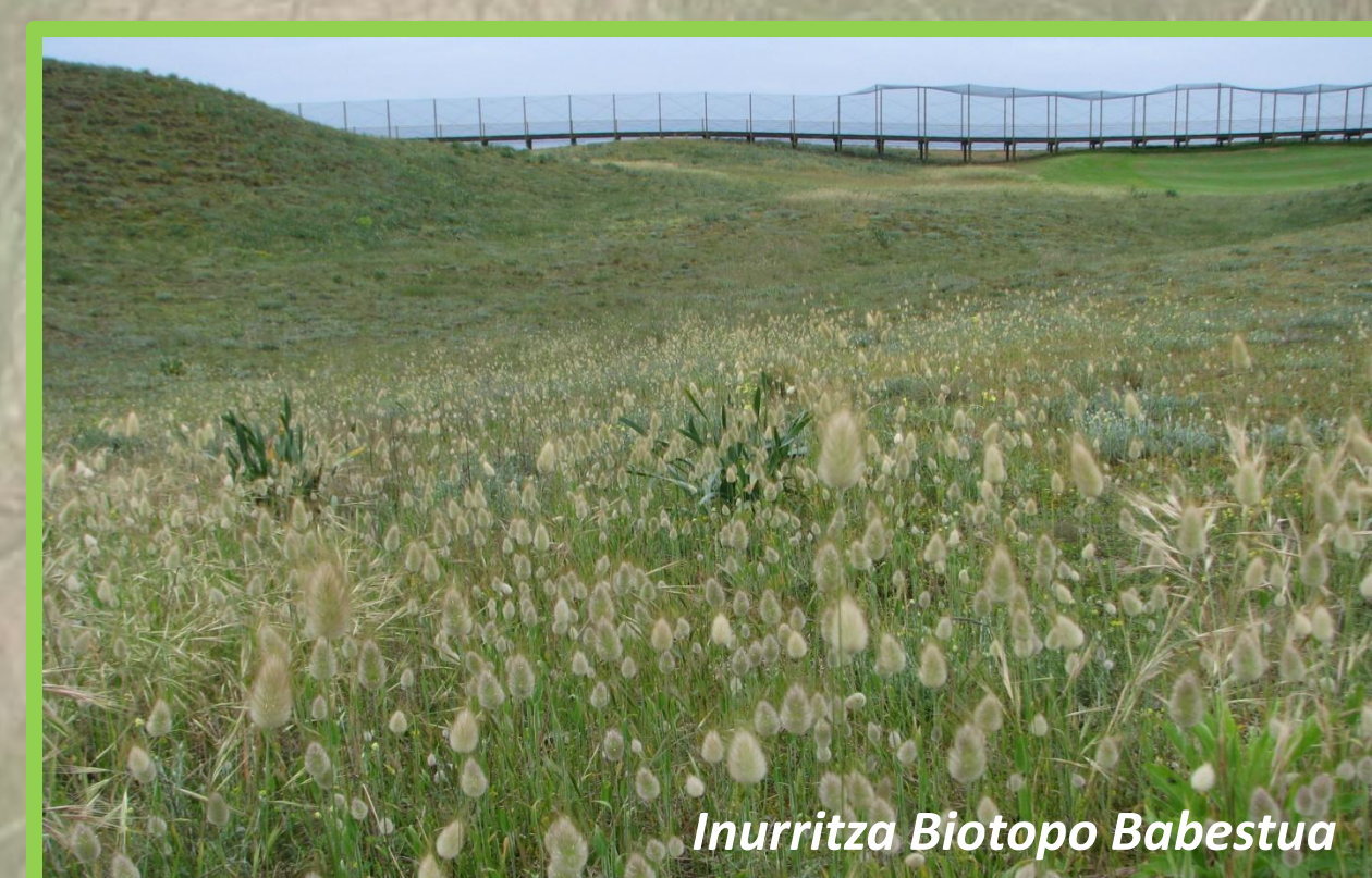
Inurritza Biotopo Babestua