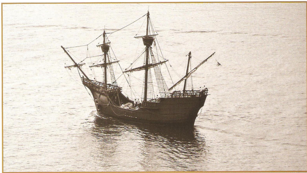
Réplica de la nao Victoria entrando a Mutriku.

D urante el siglo XVI se organizaron muchos viajes transatlánticos hacia Terranova para cazar ballenas y a la pesca del bacalao en lo que se ha denominado como el "siglo de oro" para este tipo de negocio hacia el que se dedicaron muchos recursos y personas, con el que se fletaban y armaban naos desde los puertos de la cornisa cantábrica y guipuzcoanos en particular. La documentación publicada sobre estos viajes es extensa y no es cuestión de referir aquí la amplia bibliografía que al respecto existe. Durante ese siglo no se puso impedimento alguno a que desde los puertos del litoral vasco partieran diversos navíos hacia la aventura de Terranova, a pesar de los riesgos de los conflictos bélicos, básicamente para el negocio de la ballena y del bacalao, aunque también se trajeron otras mercancías de menor importancia tales como diversos tipos de pieles conseguidas probablemente por trueque con los indígenas de la zona.