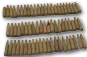
bala zorroak, Saseta defentsa sistema

1936ko Frankoren altxamendutik, Oria haraneko eremu honetako mendietan, antolatutako lehenengo erresistentzia gauzatu zen, Azpeitiko komandantziatik bultzatutako lubaki eta defentsa-elementuen bidez. Leku horietan, lehenengo liskar belikoak izan ziren, eta lehenengoz matxinatuak eten zituzten Euskal Herrian. Memoria historikoa berreskuratzeko lanen barruan, ahaztutako ondare hori dokumentatzen ari da.