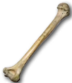
Húmero de H. Heiderbergensis, Lezetxiki