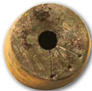
Pesa de bronce, Munoaundi

Las excavaciones en el poblado de Munoaundi se centran en analizar el modo de vida de sus habitantes durante la Edad del Hierro y su sistema defensivo (muralla y sistema de acceso al recinto). Actualmente, la investigación se centra en dos áreas en las que se estudian el acceso al recinto y el área de habitación junto a la muralla.