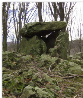
Aitzetako Txabala, Txoritokieta

Colaboran: Ayuntamiento de Erreenteria, Diputación Foral de Gipuzkoa.