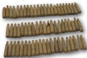
Casquillos de bala, sistema defensivo Saseta

A raíz de la sublevación franquista de 1936 en los montes de esta zona del valle del Oria se materializó la primera resistencia organizada a través de trincheras y elementos defensivos impulsados desde la comandancia de Azpeitia. En estos lugares se produjeron los primeros enfrentamientos de carácter bélico, que frenaron por primera vez a los sublevados en el País Vasco. Dentro de las labores de recuperación de la memoria histórica se está documentando este patrimonio olvidado.