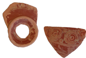
Fragmentos de terra sigillata , Zaldua

Excavación arqueológica que tiene por objeto la delimitación y definición de las estructuras constructivas del principal asentamiento urbano ubicado en la calzada romana ITERXXXIV por el Pirineo. La excavación está dirigida por expertos del Museum of London Archaeology (MOLA) y está destinada al aprendizaje de los Sistemas de Registro Arqueológico utilizados por esta institución.