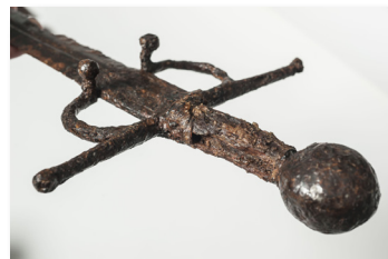
Espada de Amaiur

Colaboran: Amaiurko Herrie, Ayuntamiento de Baztan, Gobierno de Navarra.