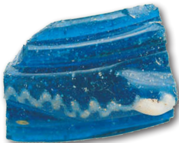
Fragmento de brazalete, Basagain

El poblado de la Edad del Hierro se sitúa en el monte Basagain en Anoeta (Gipuzkoa) y desde hace más de 20 años se ha constatado la actividad comercial en él con la aparición de útiles de hierro, cerámicas y cuentas de abalorios en diferentes puntos. Es uno de los poblados fortificados arqueológicamente más activo del País Vasco.