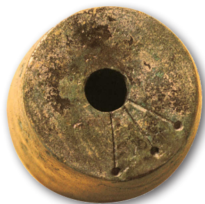
Pesa de bronce, Munoaundi

Colaboran: Ayuntamientos de Azpeitia y Azkoitia, Diputación Foral de Gipuzkoa.