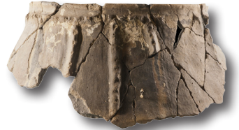
Cerámica del Bronce, San Adrian.

El paso de San Adrian Lizarrate es un yacimiento en cueva que alberga materiales arqueológicos que van desde el paleolítico superior hasta el siglo XX. Útiles de sílex, cerámicas, restos óseos humanos y de fauna, monedas y fragmentos de armas, así como antiguas construcciones afloran en esta cueva situada en las profundidades de Gipuzkoa, a más de 1000 metros de altura.