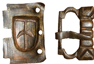
Hebillas y apliques, Irulegi

Colabora: Ayuntamiento del Valle de Aranguren, Gobierno de Navarra.